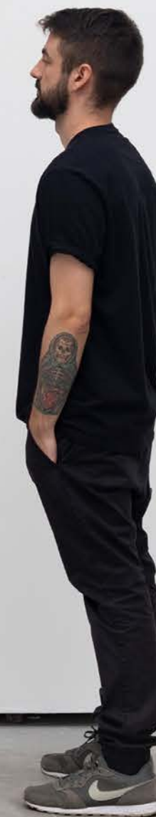
BÁRBARA WAGNER & BENJAMIN DE BURCA Fala da Terra [Voice of the Land], 2022