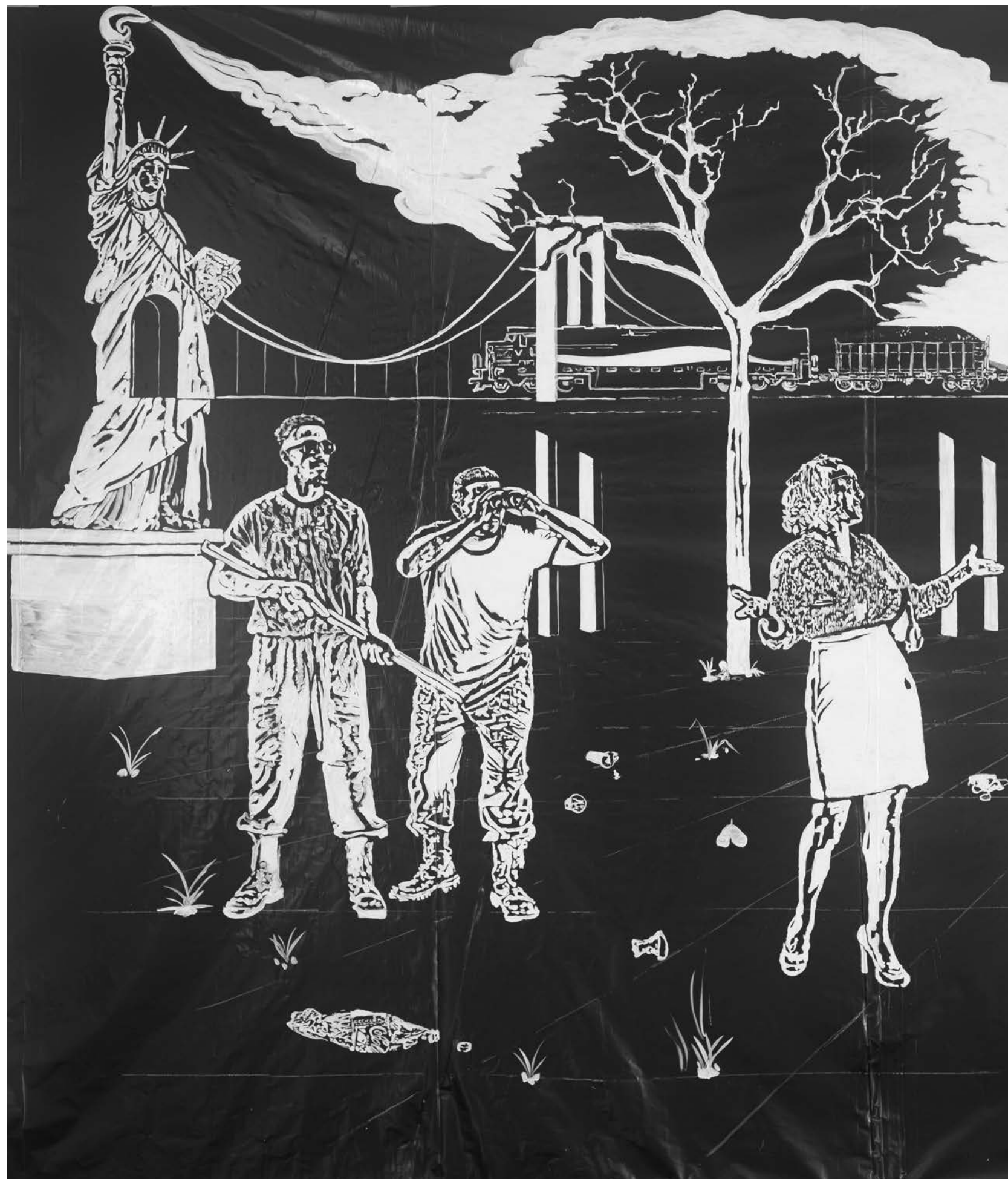
BÁRBARA WAGNER & BENJAMIN DE BURCA Fala da Terra [Voice of the Land], 2022 Detalhe [Detail]