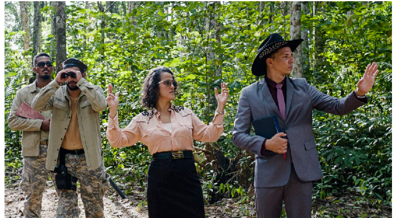
BÁRBARA WAGNER E BENJAMIN DE BURCA Fala da Terra [Voice of the Land], 2022 Vídeo 2K, HD, cor, som 5.1 17'26" Edição de [Edition of] 5 + 2 AP