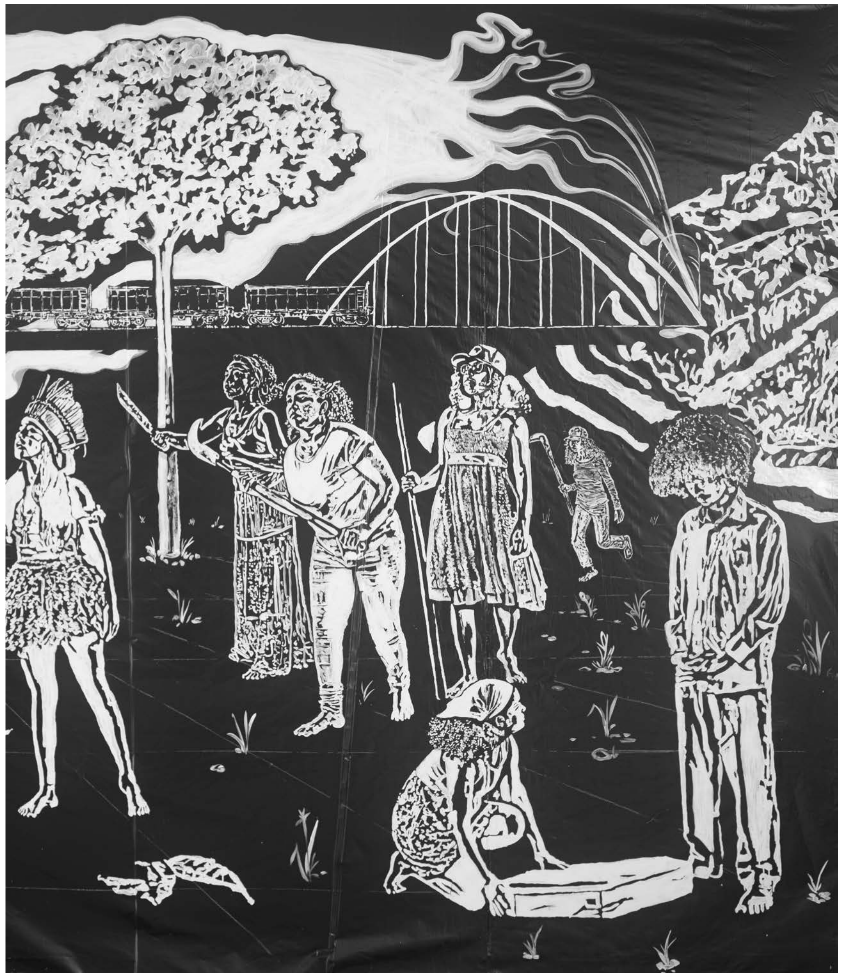
BÁRBARA WAGNER & BENJAMIN DE BURCA Fala da Terra [Voice of the Land], 2022 Detalhe [Detail]