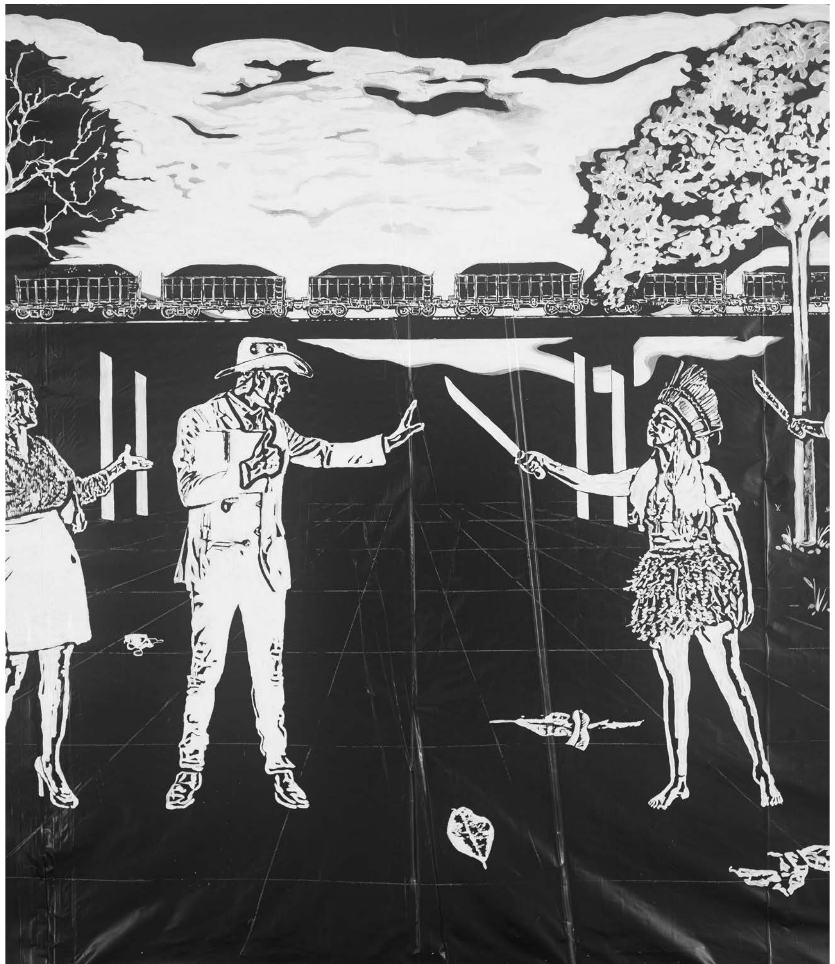
BÁRBARA WAGNER & BENJAMIN DE BURCA Fala da Terra [Voice of the Land], 2022 Detalhe [Detail]