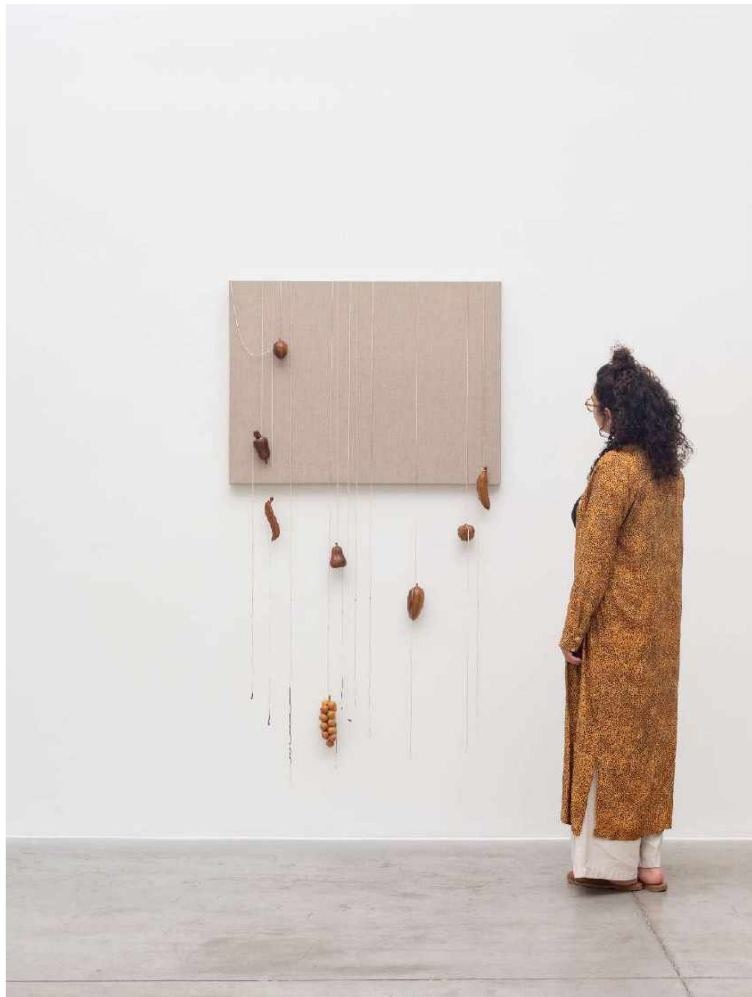
VALESKA SOARES Untitled III (from Equivalents), 2020