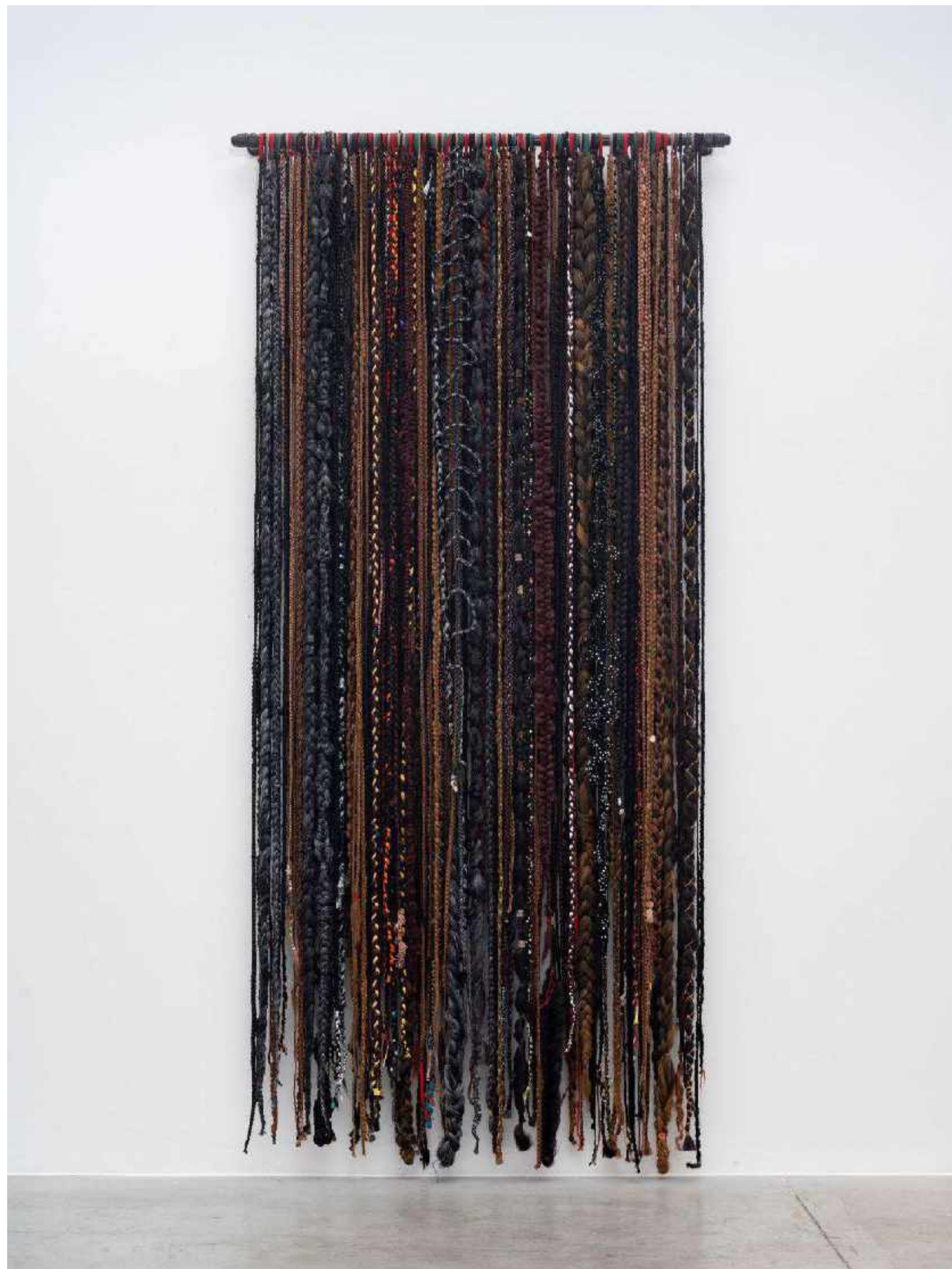
SARA RAMO E TATIANE SELIO lapso trecho brecha passo meio fluxo flecha, 2023 Cabelo orgânico, cabelo sintético e tecido [Organic hair, synthetic hair and fabric] 255 x 120 cm [100.4 x 47.2 in]