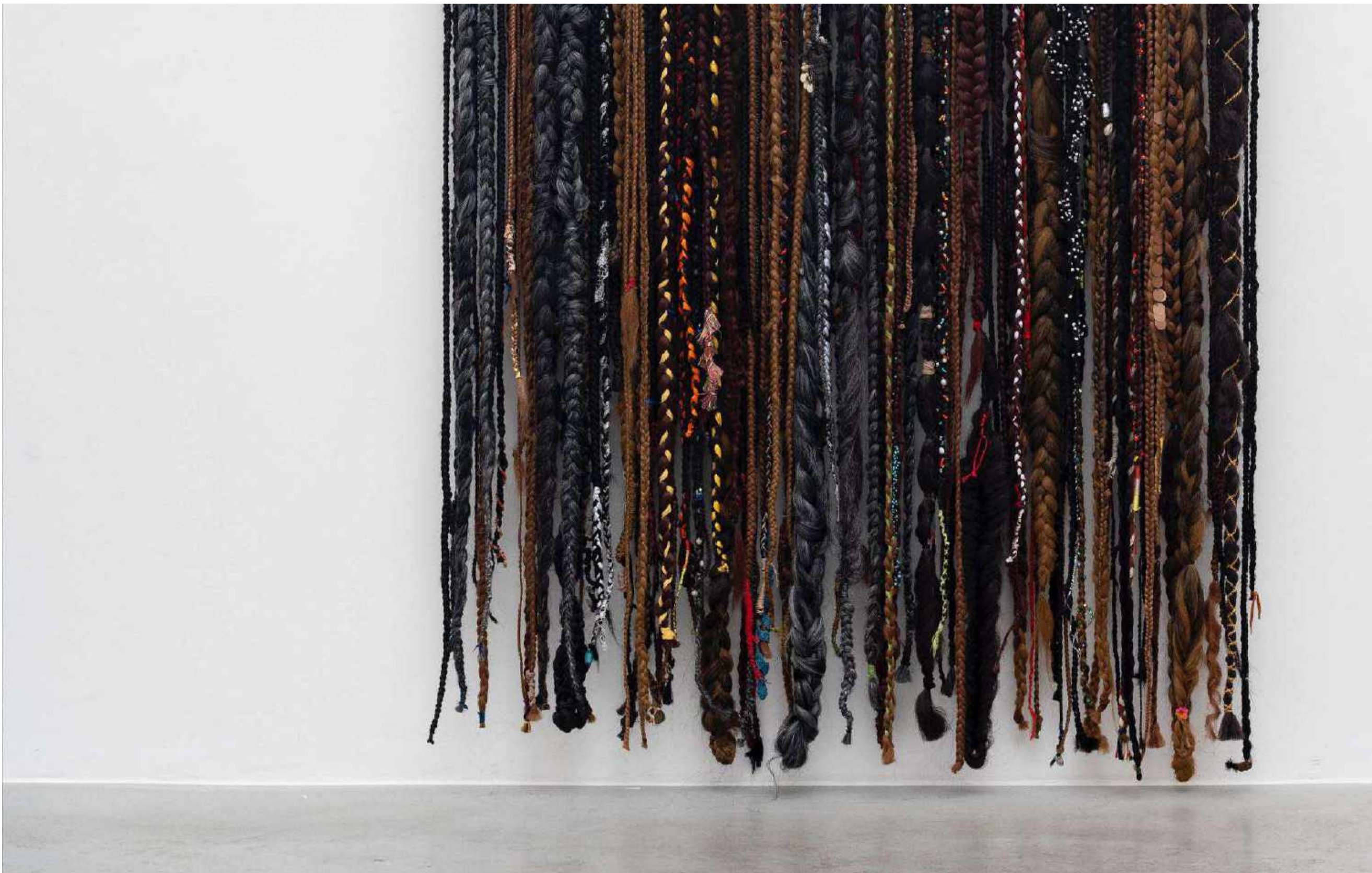
SARA RAMO E TATIANE SELIO lapso trecho brecha passo meio fluxo flecha, 2023 Detalhe [Detail]