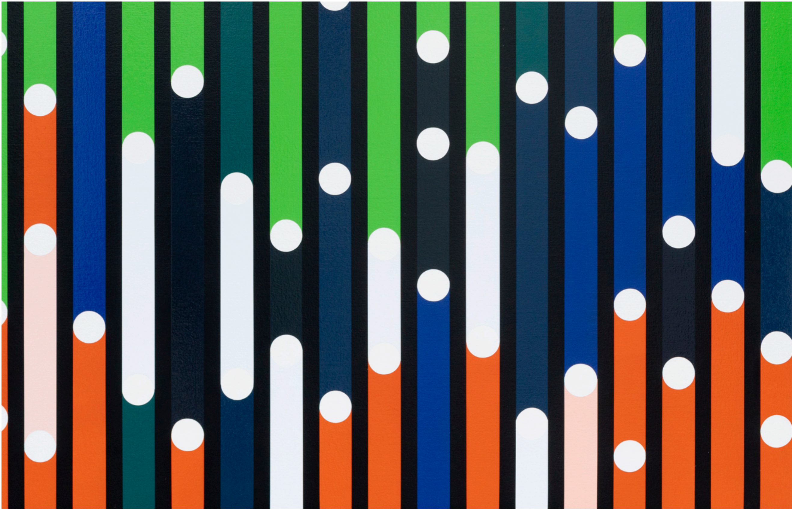
SARAH MORRIS War of Roses [Sound Graph], 2022 Detalhe [Detail]