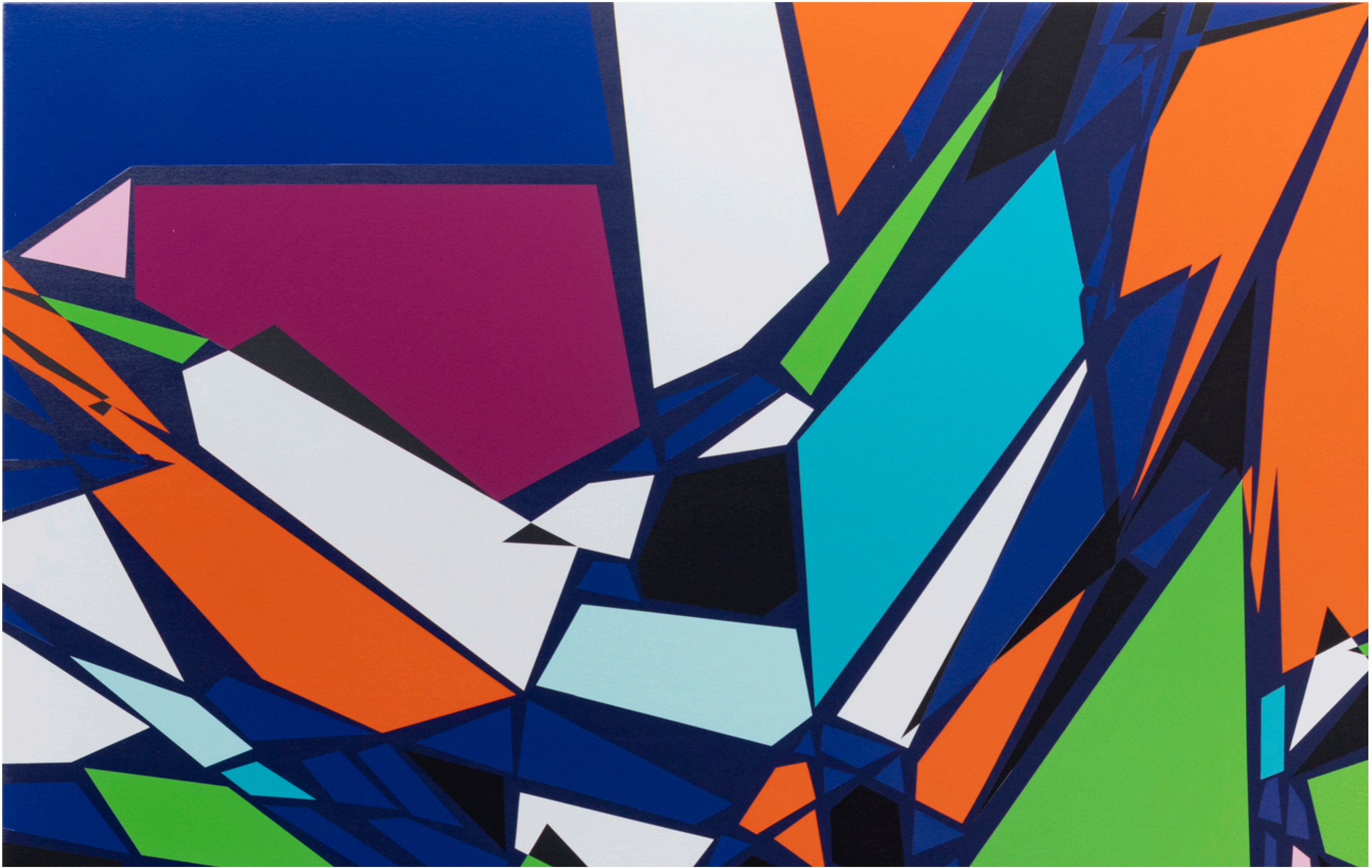
SARAH MORRIS Gridlock [Spiderweb], 2022 Detalhe [Detail]