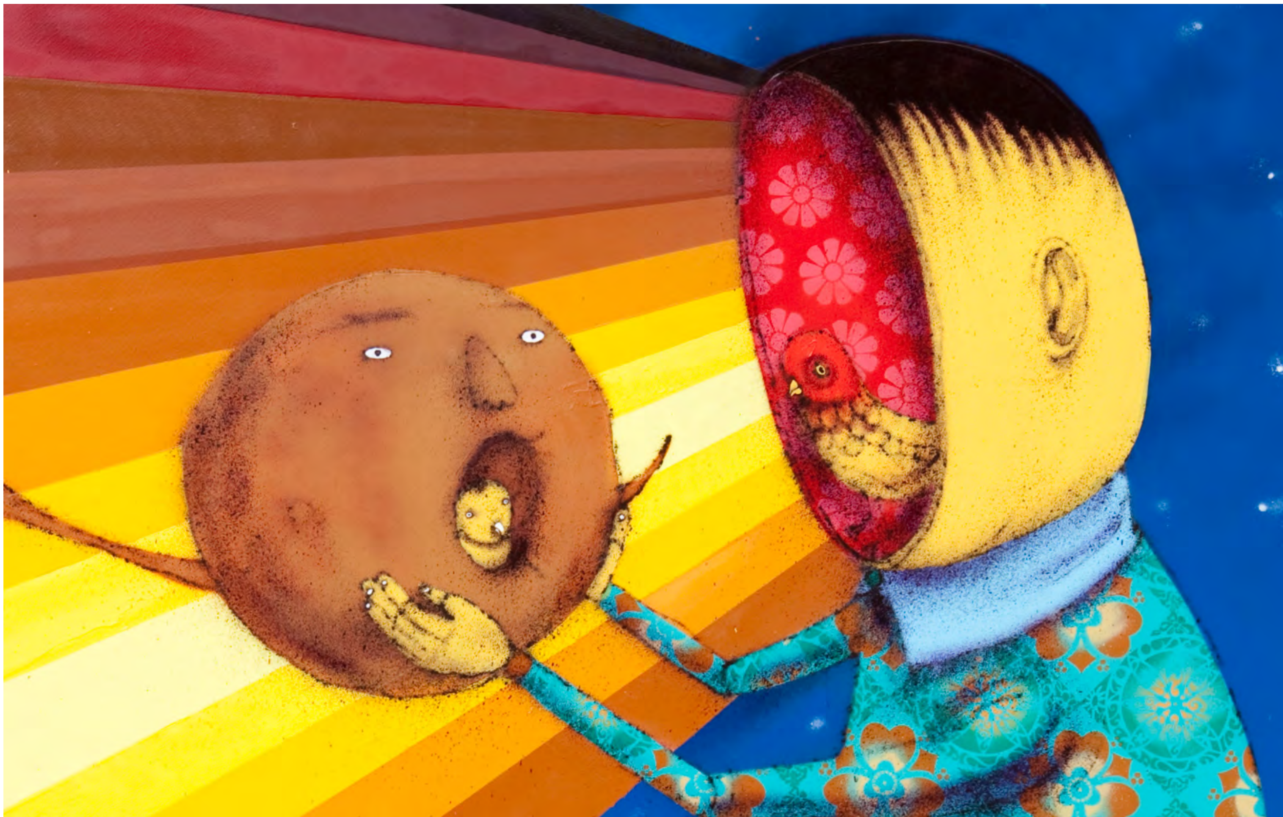
OSGEMEOS Sem título, 2009 Detalhe [Detail]