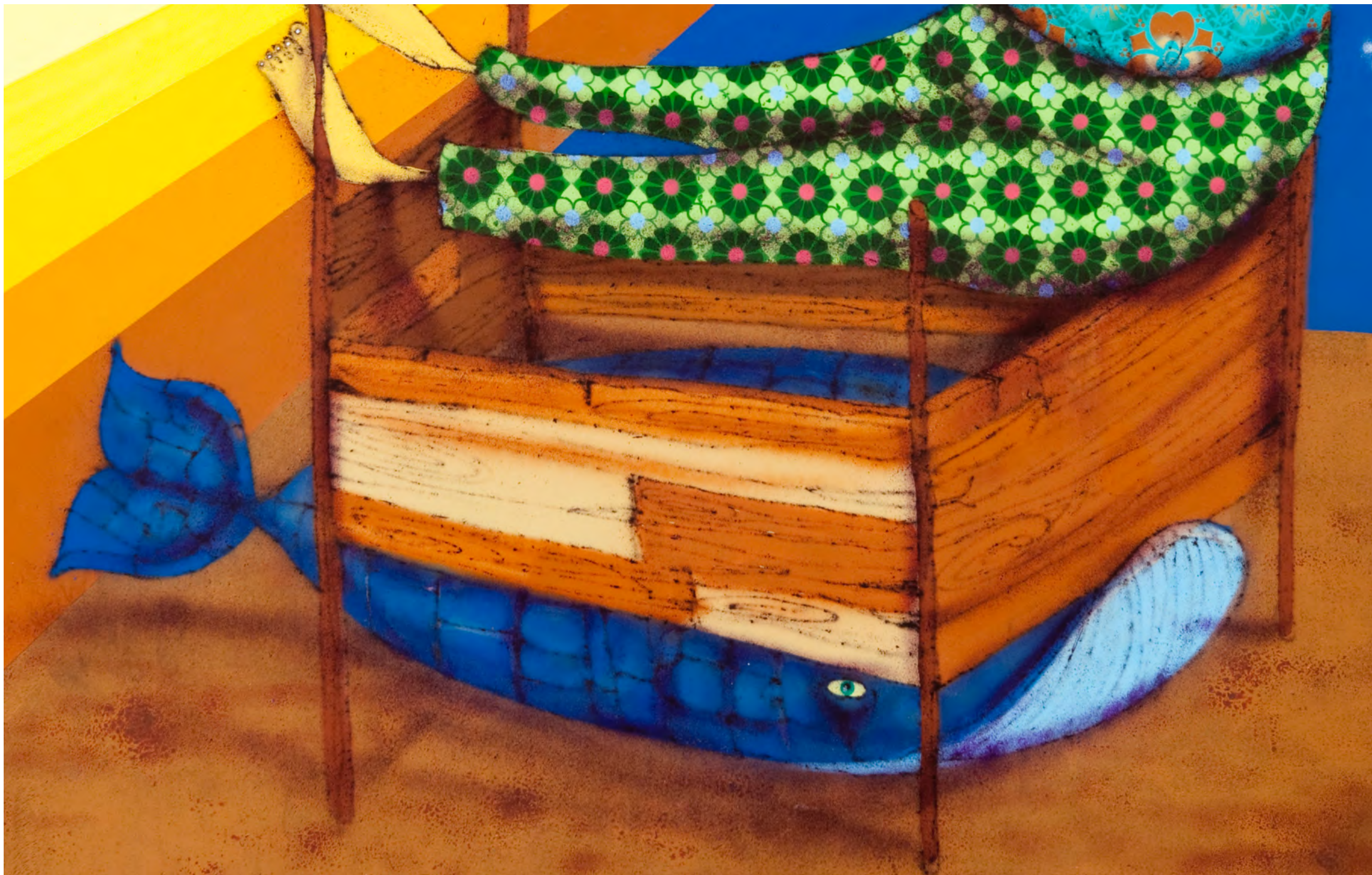
OSGEMEOS Sem título, 2009 Detalhe [Detail]