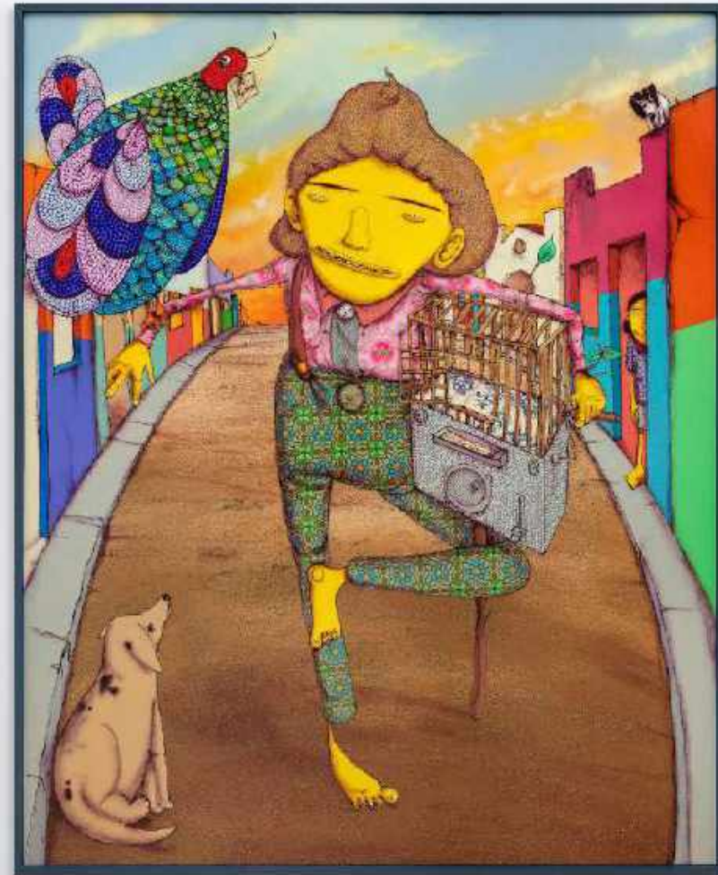
OSGEMEOS O cachorro cantor / The singer dog, 2022