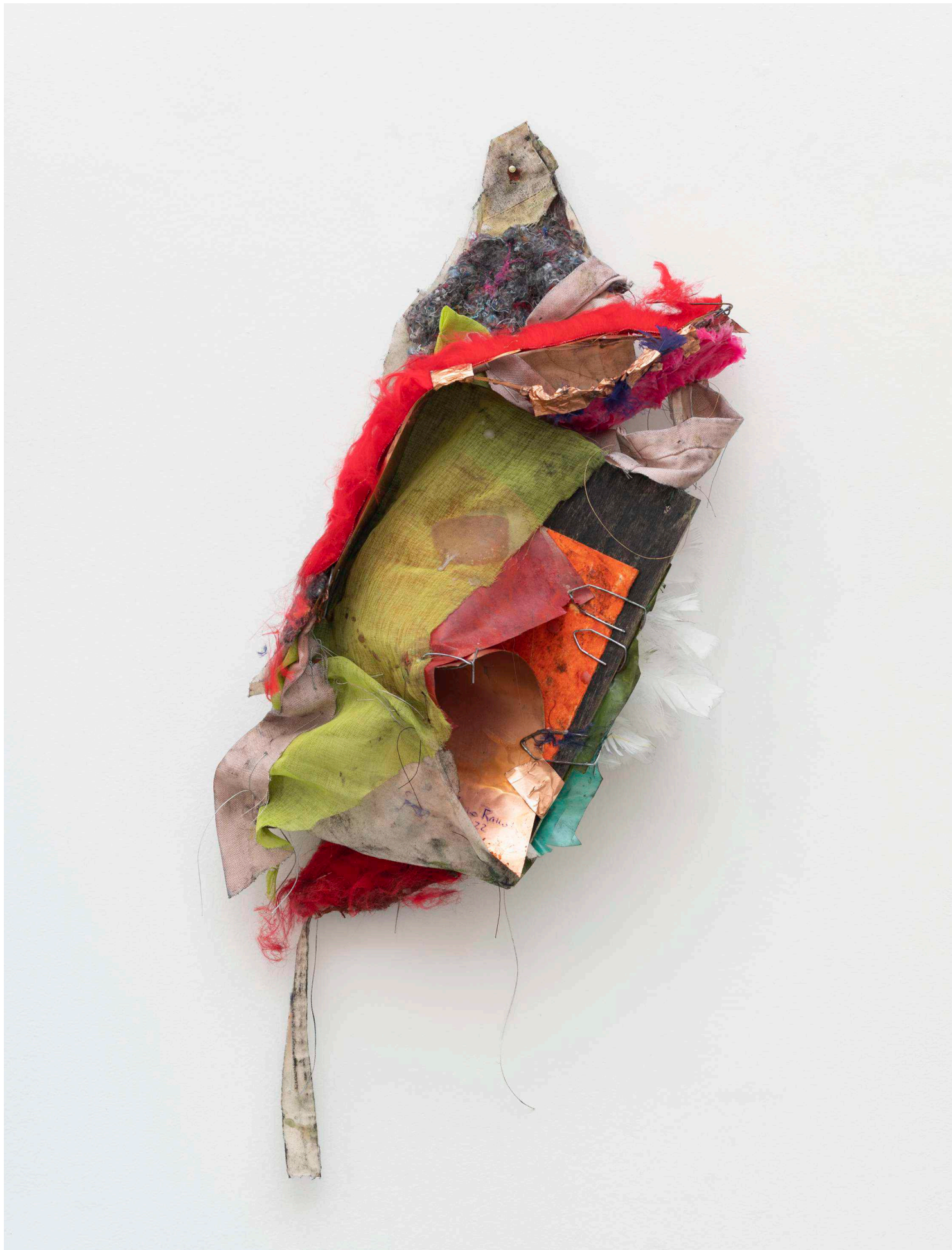
NUNO RAMOS Waiting for my wings, 2022 Técnica mista [Mixed media] 75 x 25 x 25 cm [29.5 x 9.8 x 9.8 in]