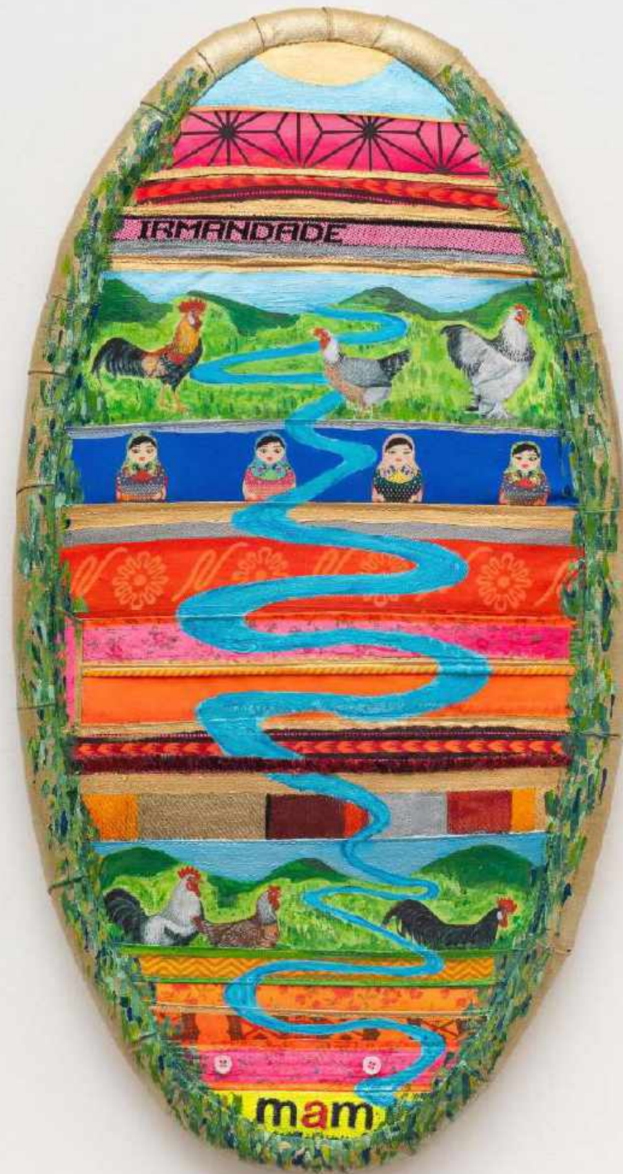
LEDA CATUNDA Irmandade, 2023

Acrílico e esmalte sobre tecido [Acrylic and enamel on fabric] 73 x 39 cm [28.7 x 15.3 in]