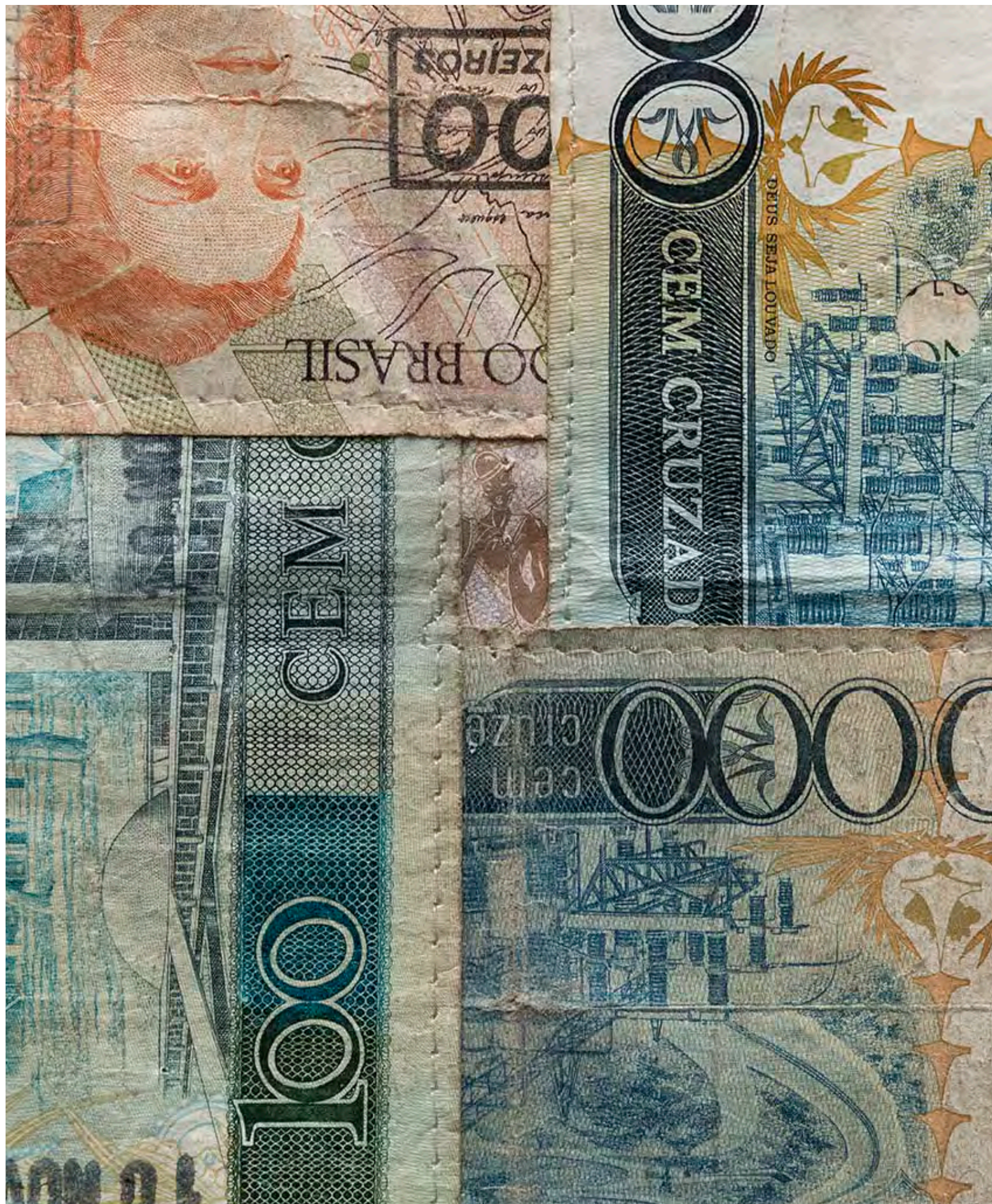
JAC LEIRNER Todos os Cem, 1998 Detalhe [Detail]