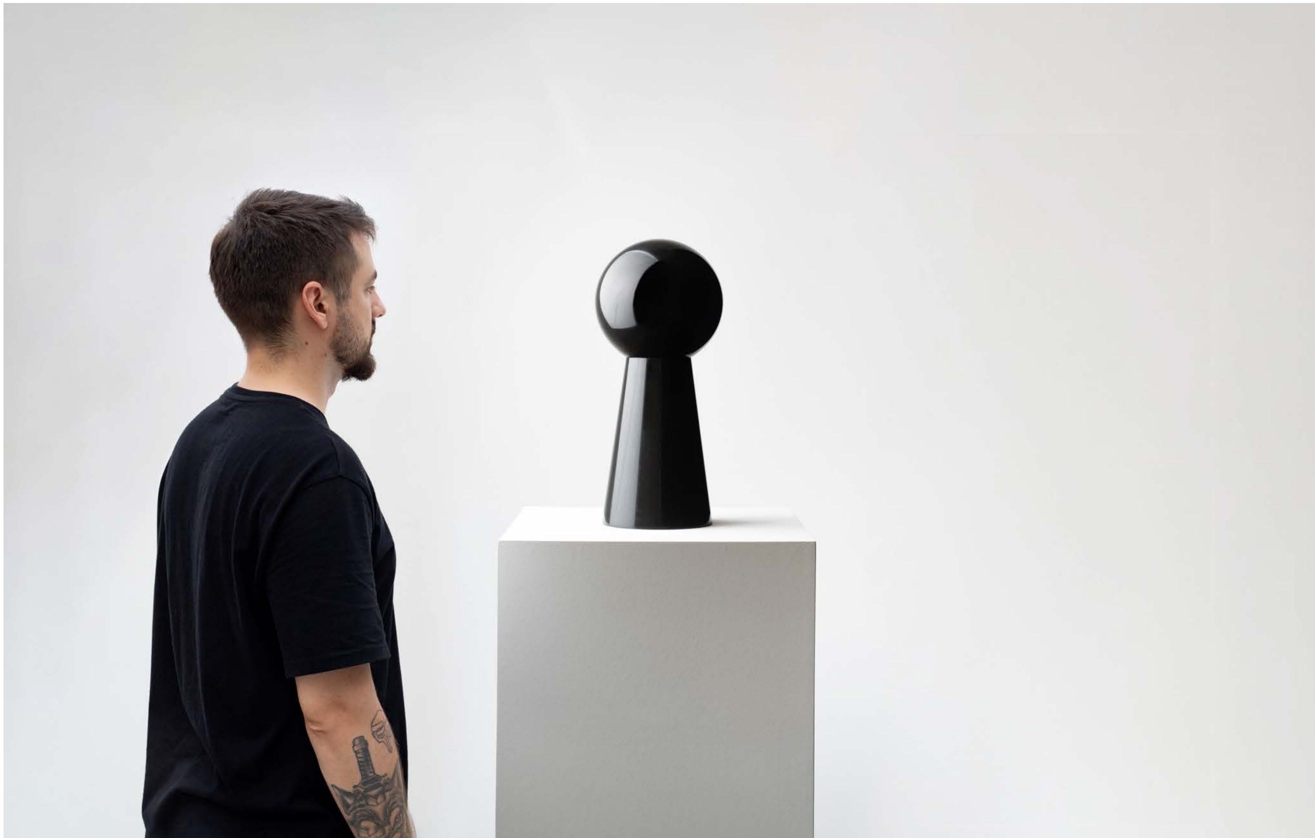
IRAN DO ESPÍRITO SANTO Sem título (buraco de fechadura), 2002