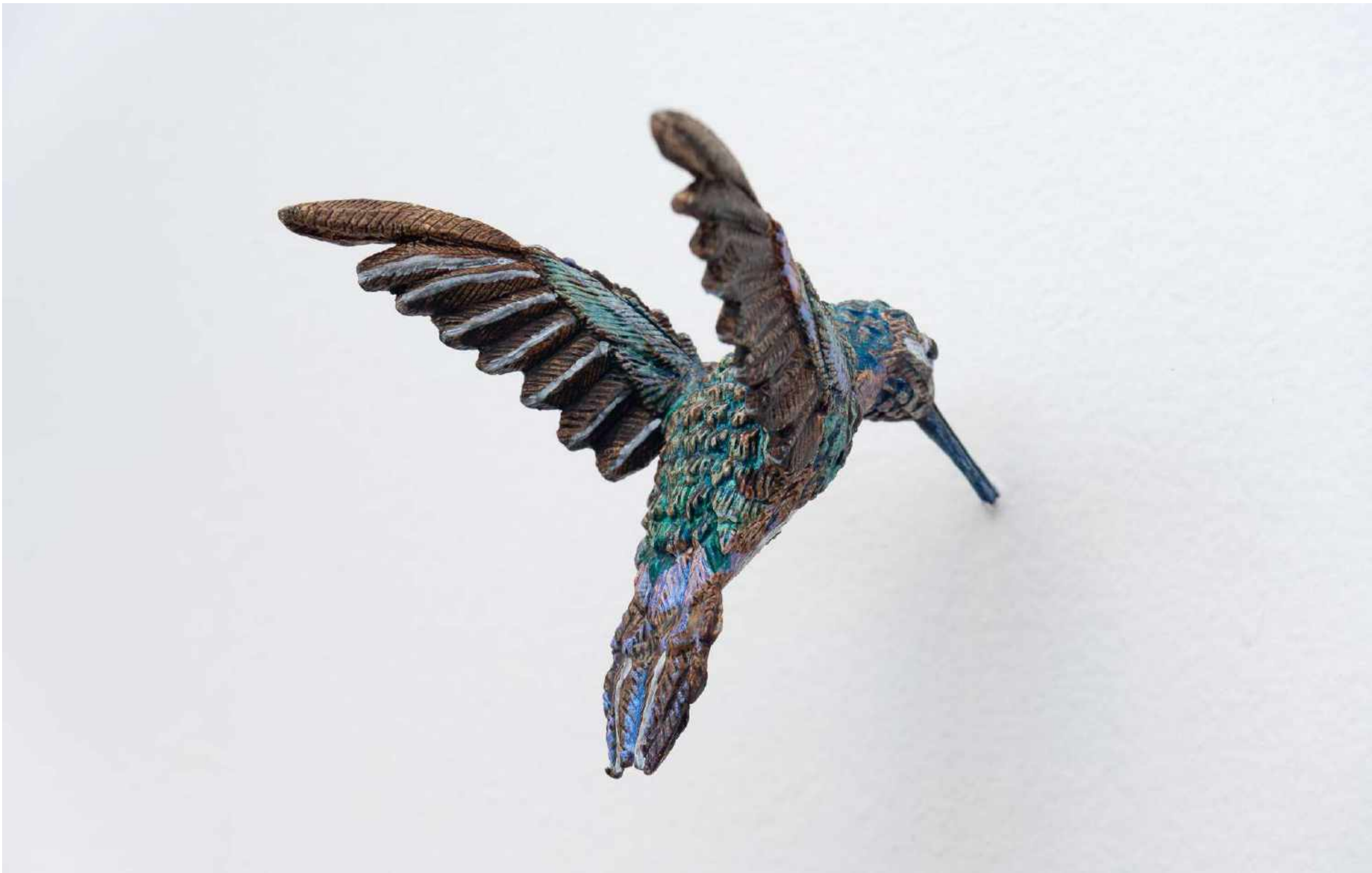
EFRAIN ALMEIDA Uma pausa em pleno voo, 2021 Detalhe [Detail]