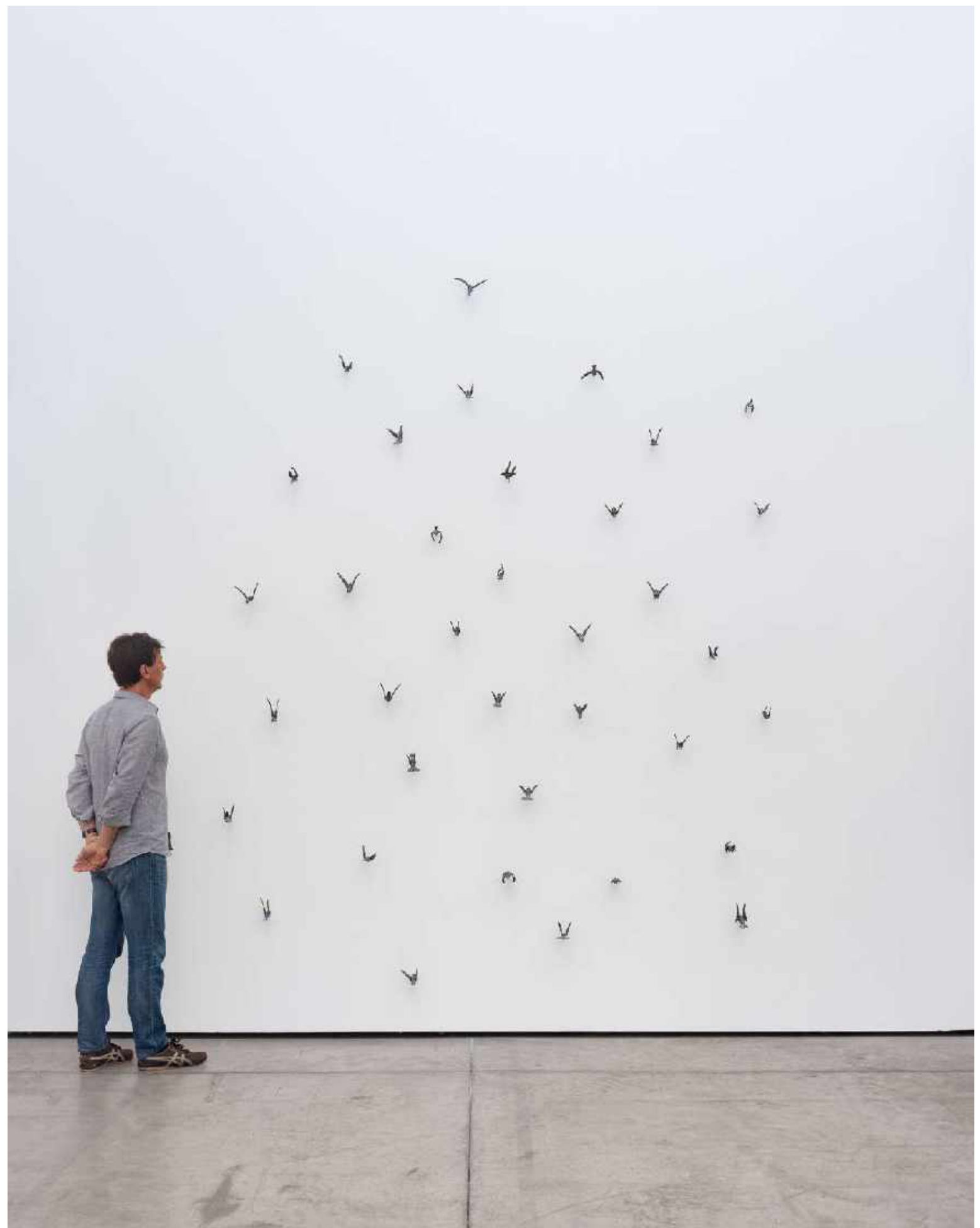
EFRAIN ALMEIDA Uma pausa em pleno voo, 2021