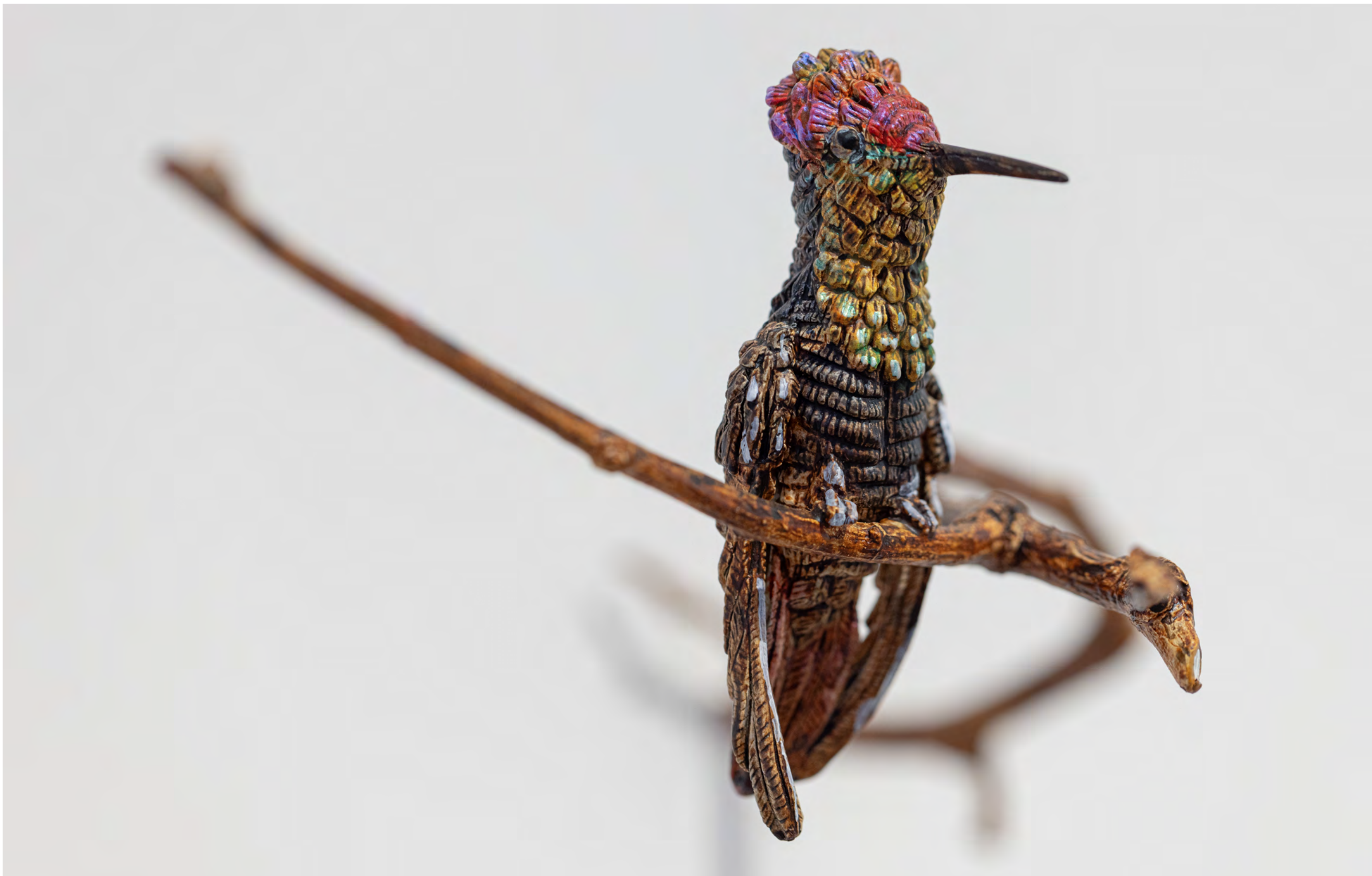
EFRAIN ALMEIDA Beija-flor (vermelho), 2023 Detalhe [Detail]