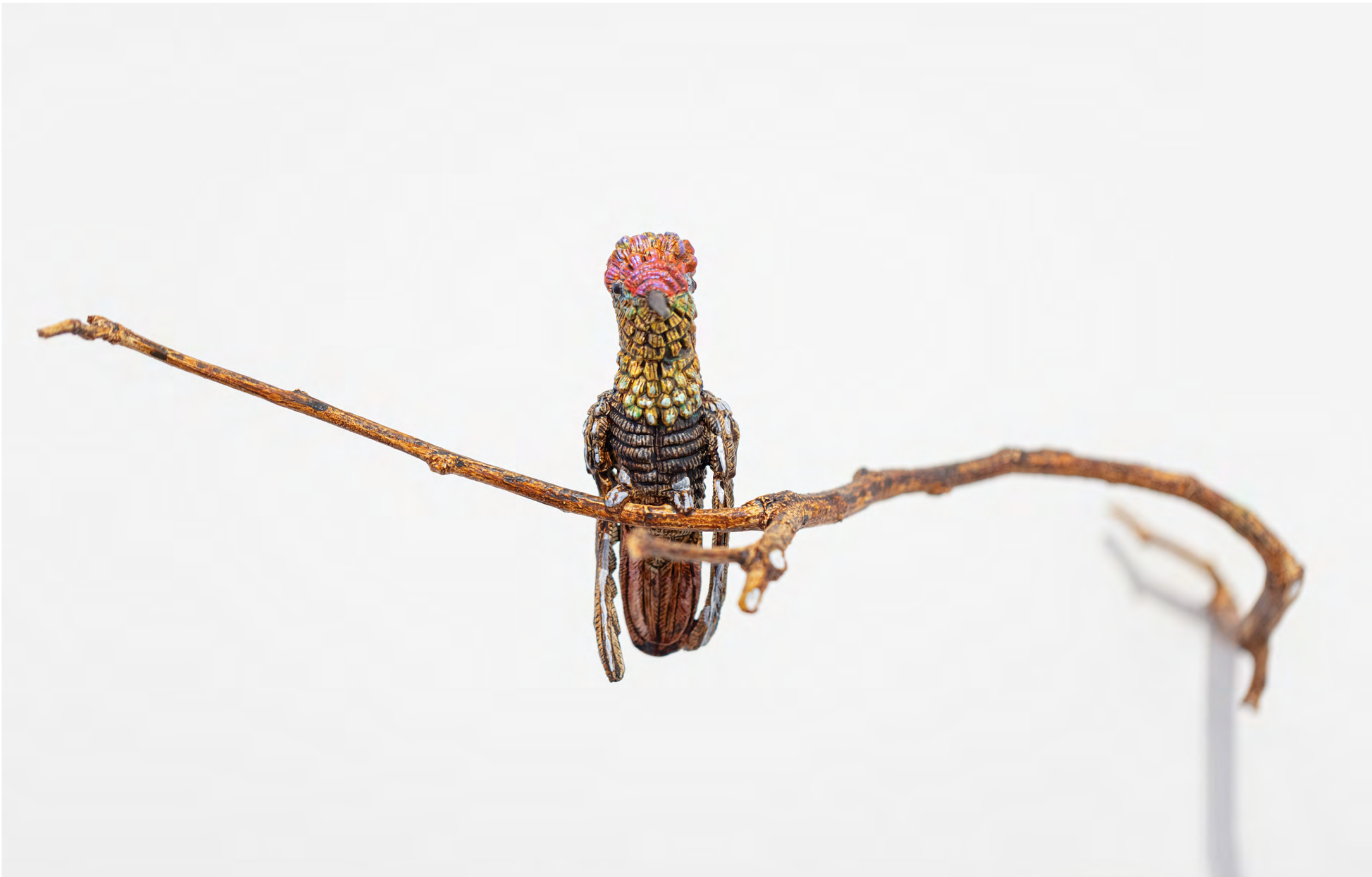
EFRAIN ALMEIDA Beija-flor (vermelho), 2023