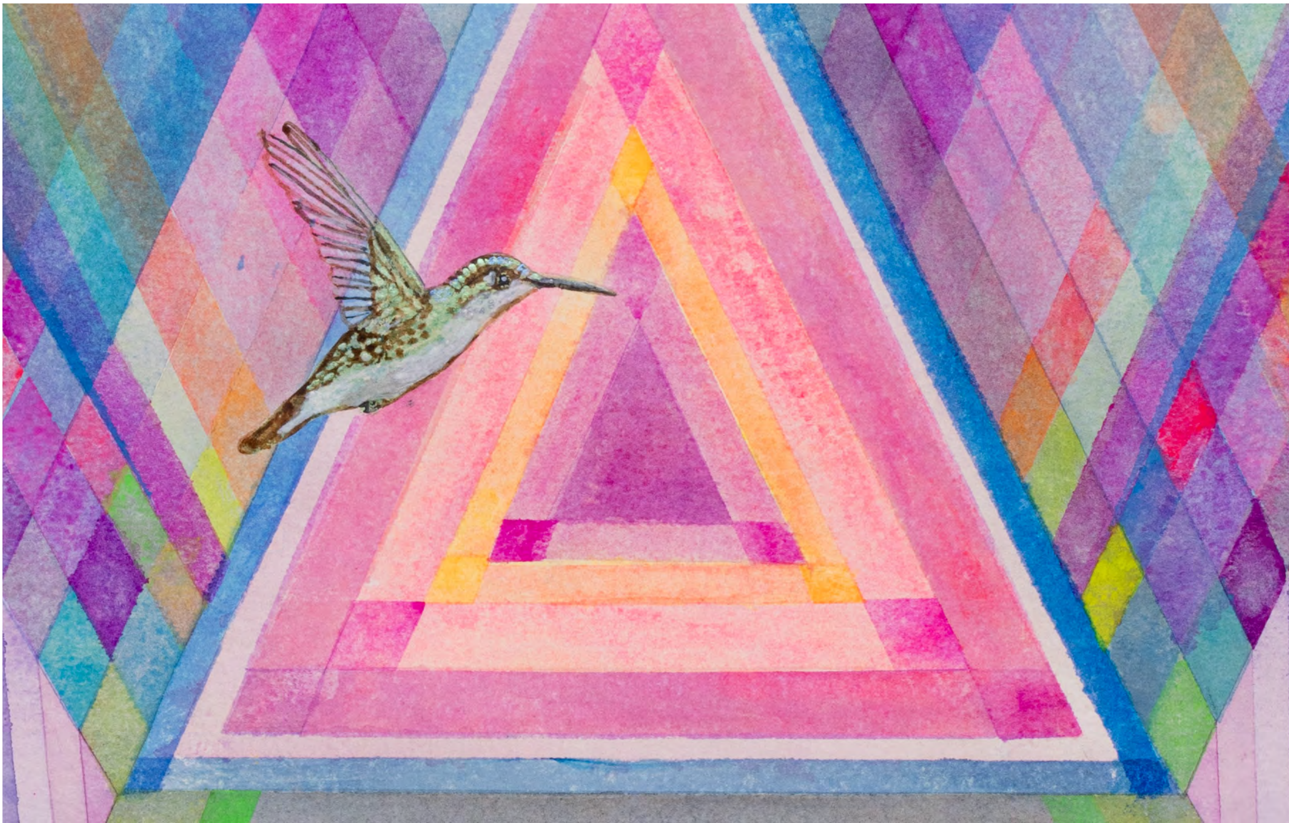
EFRAIN ALMEIDA Prisma (delírio), 2024 Detalhe [Detail]