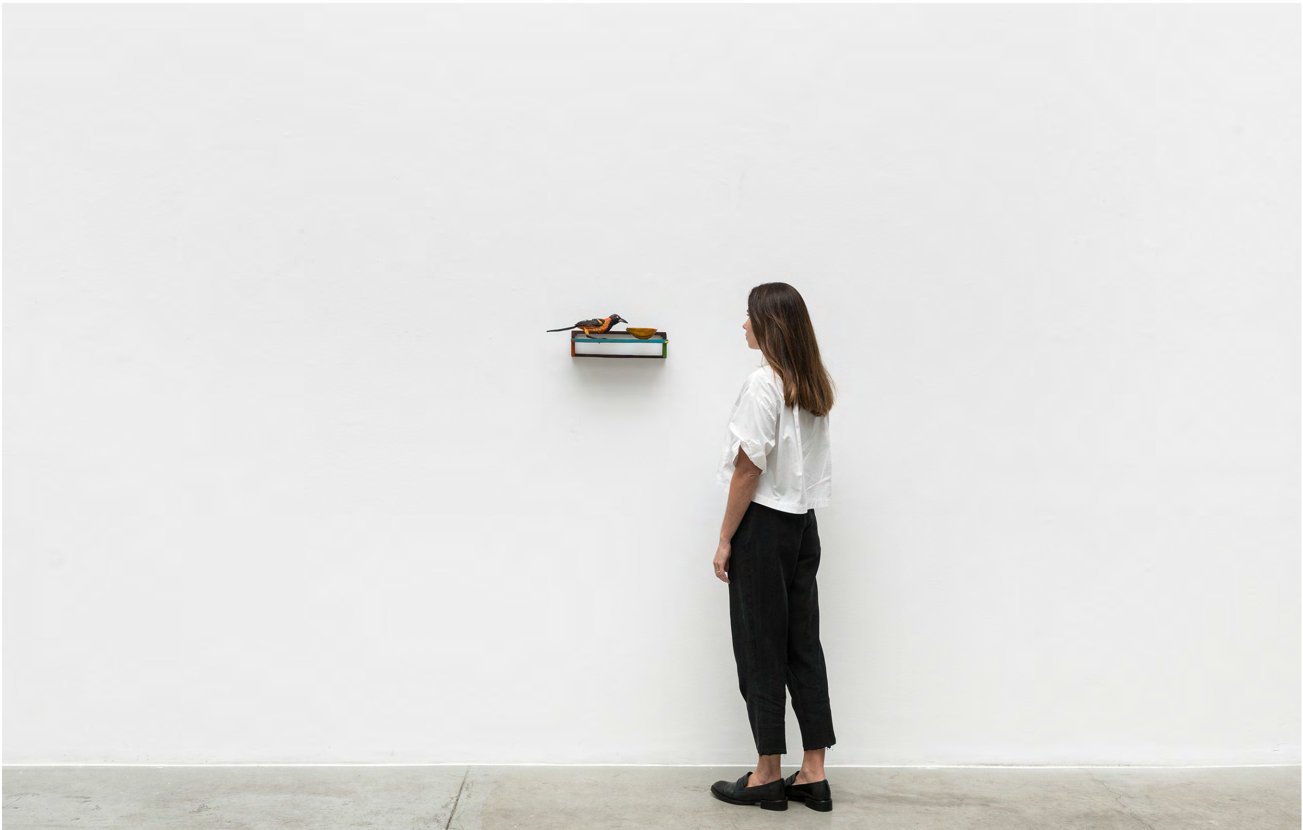
EFRAIN ALMEIDA O resiliente, 2023