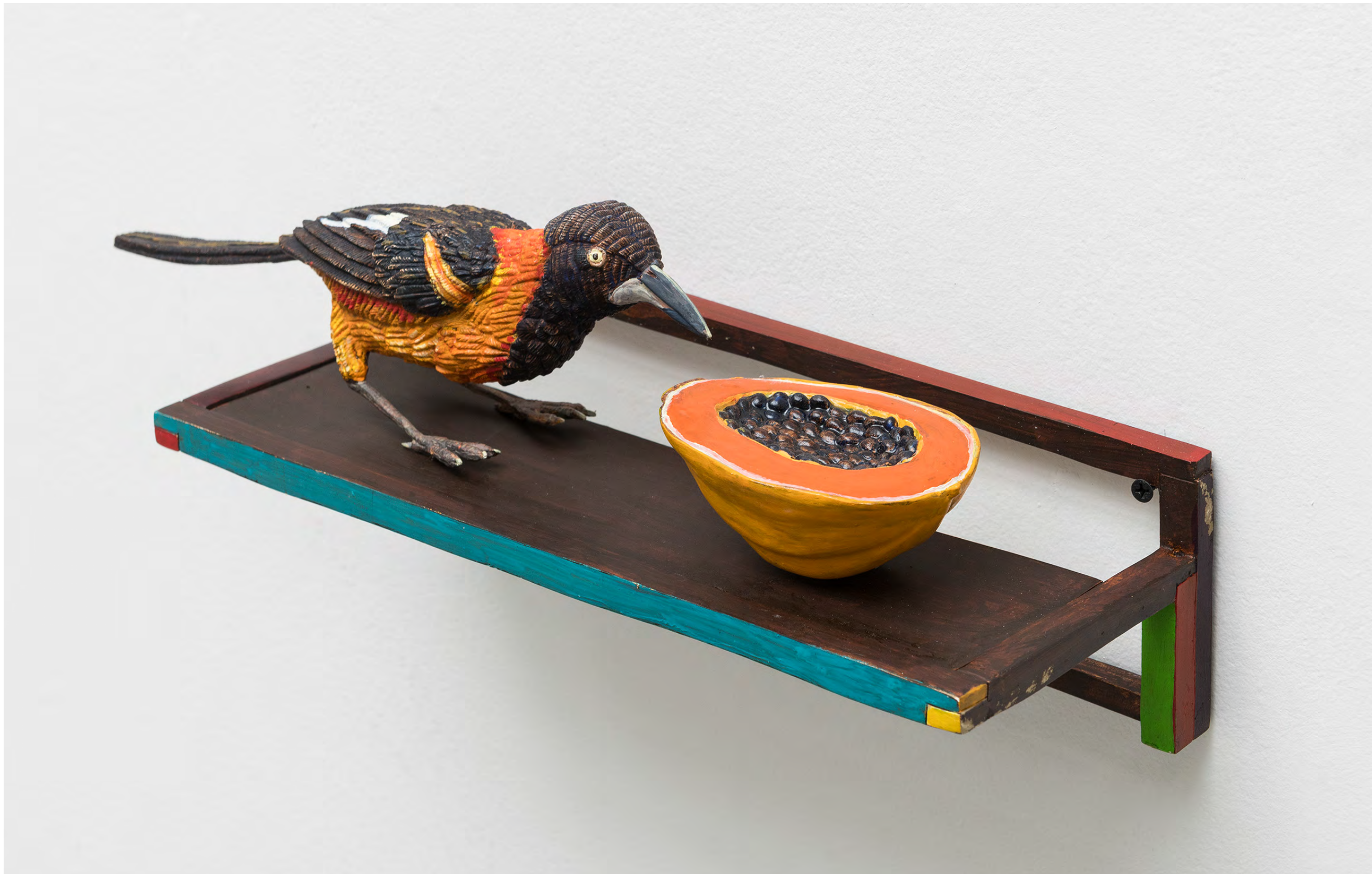
EFRAIN ALMEIDA O resiliente, 2023