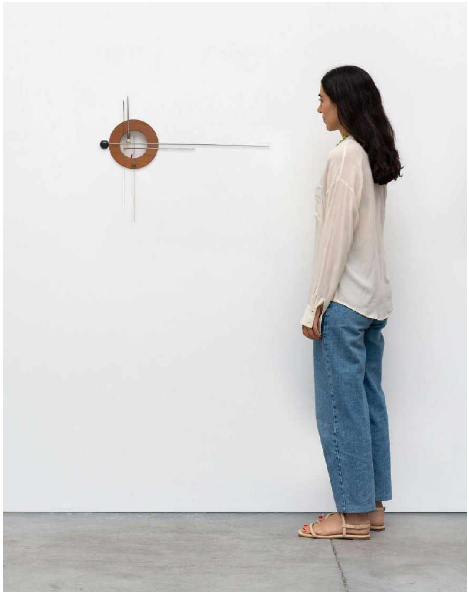
CARLOS BEVILACQUA Ek-sistere, 2011