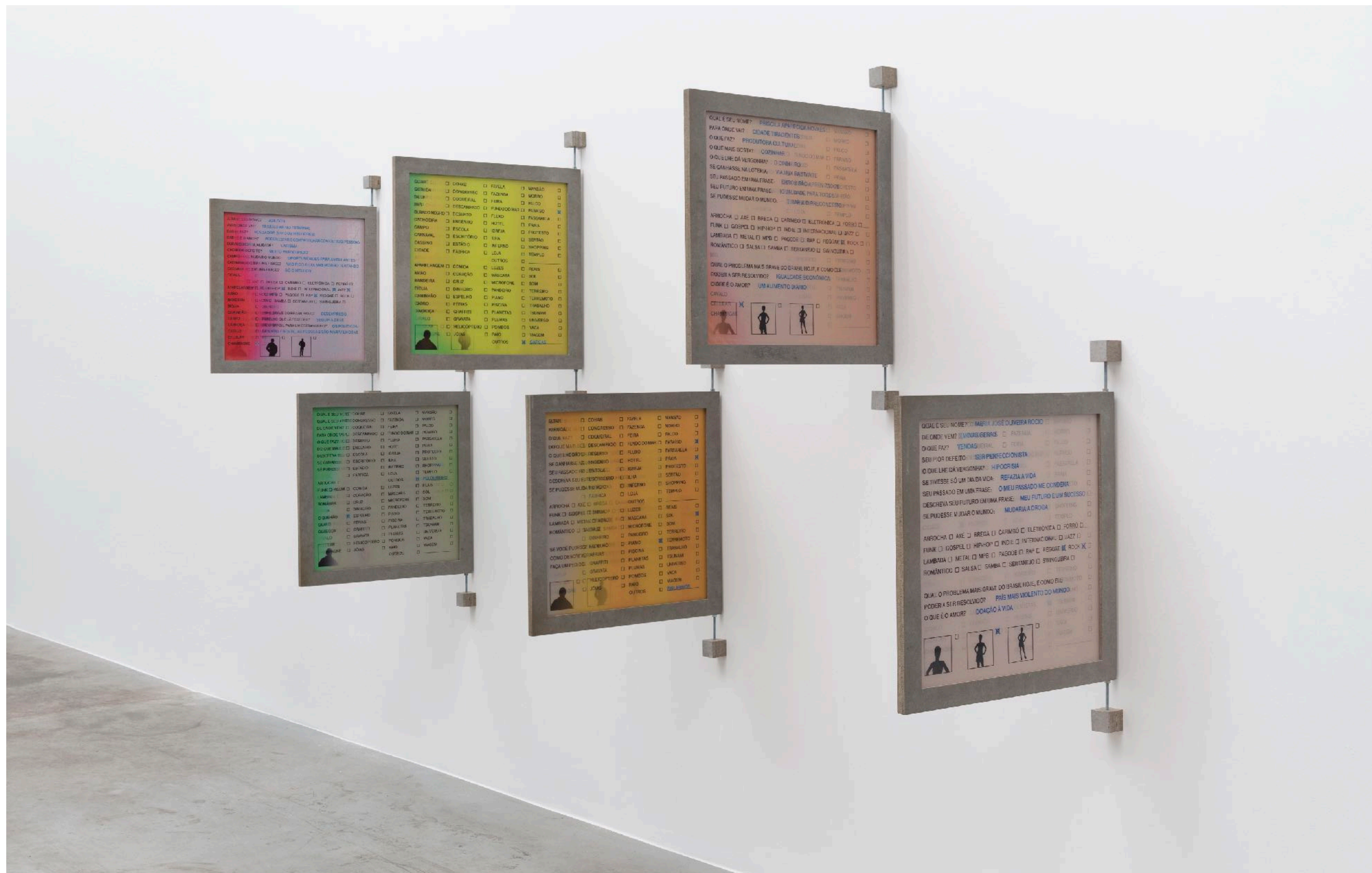
BÁRBARA WAGNER & BENJAMIN DE BURCA Como se Fosse Verdade | Parte 2, 2017