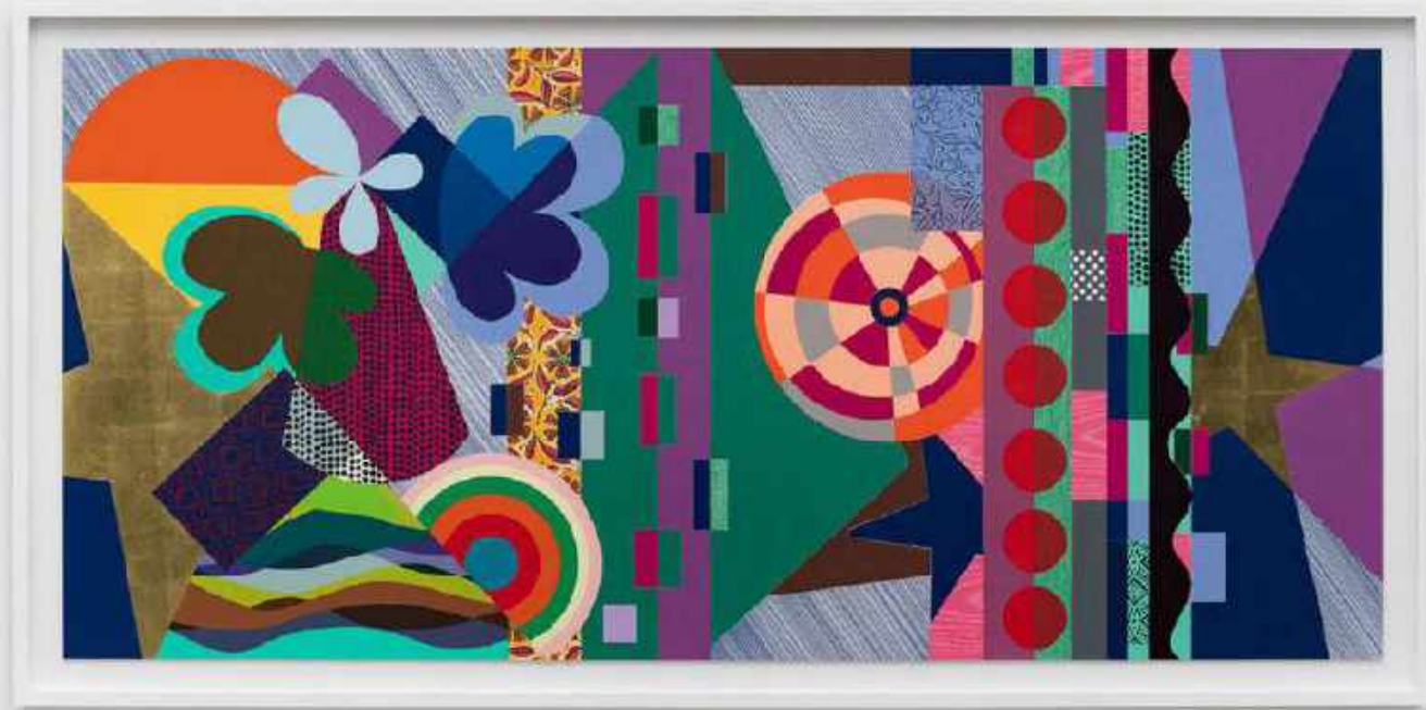
BEATRIZ MILHAZES Dovetail, 2019