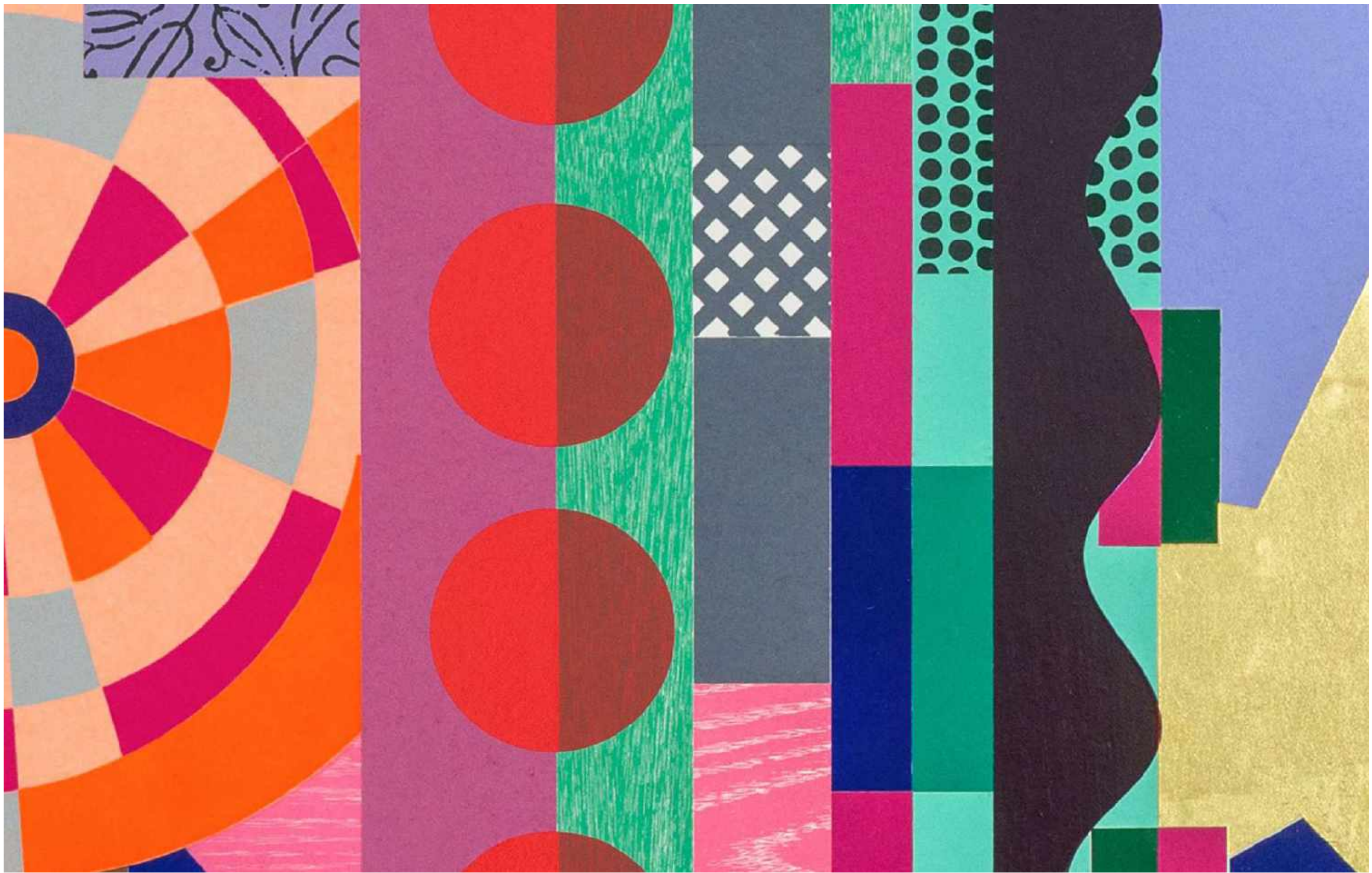
BEATRIZ MILHAZES Dovetail, 2019 Detalhe [Detail]