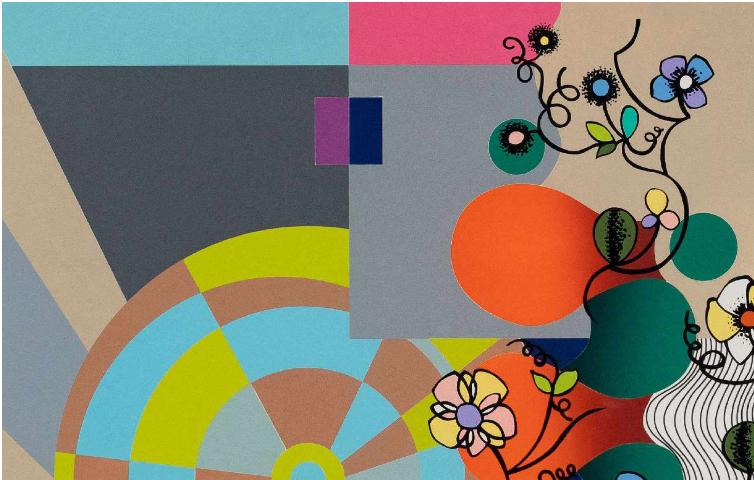
BEATRIZ MILHAZES Flower Swing, 2019 Detalhe [Detail]