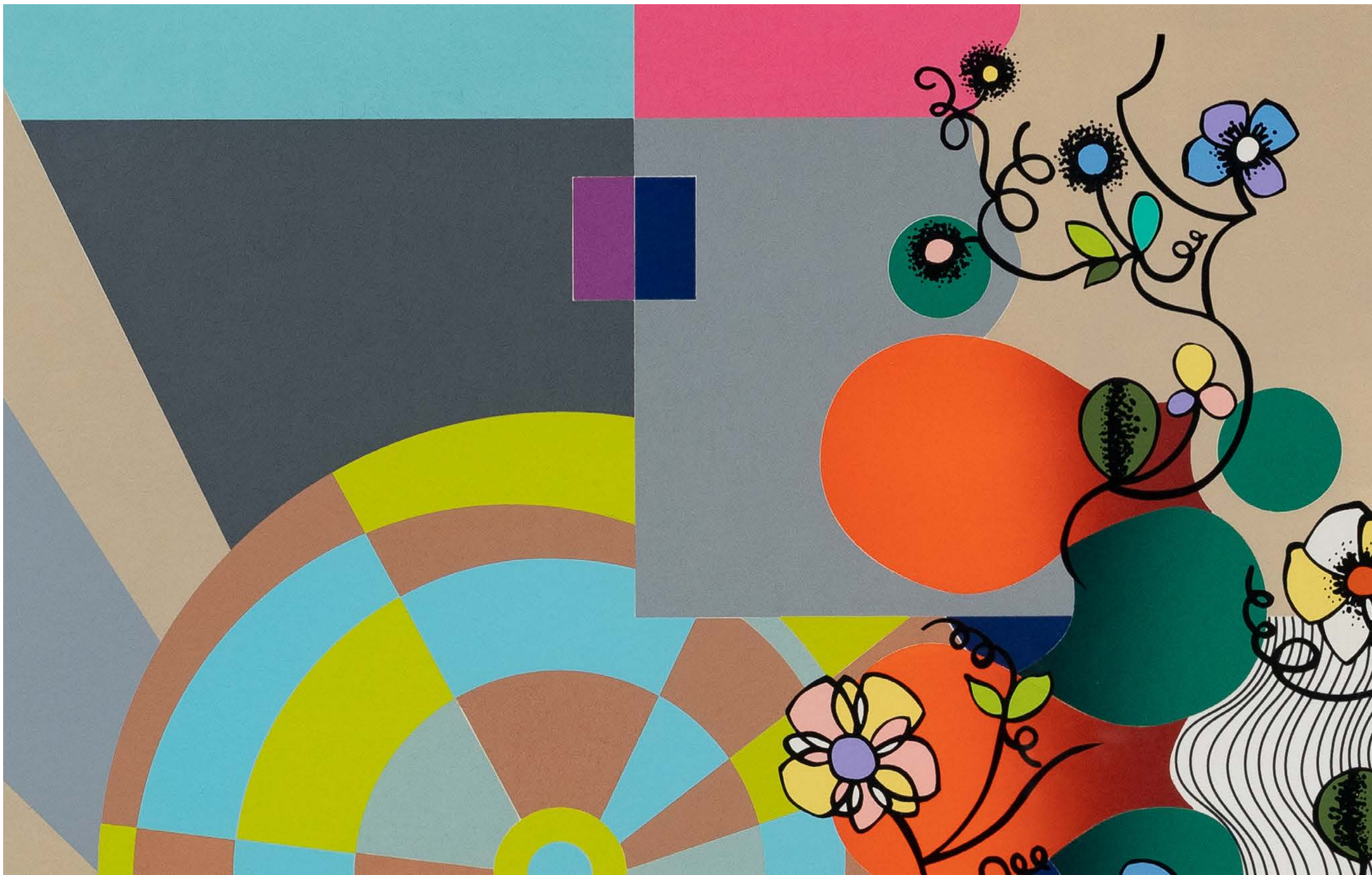
BEATRIZ MILHAZES Flower Swing, 2019 Detalhe [Detail]