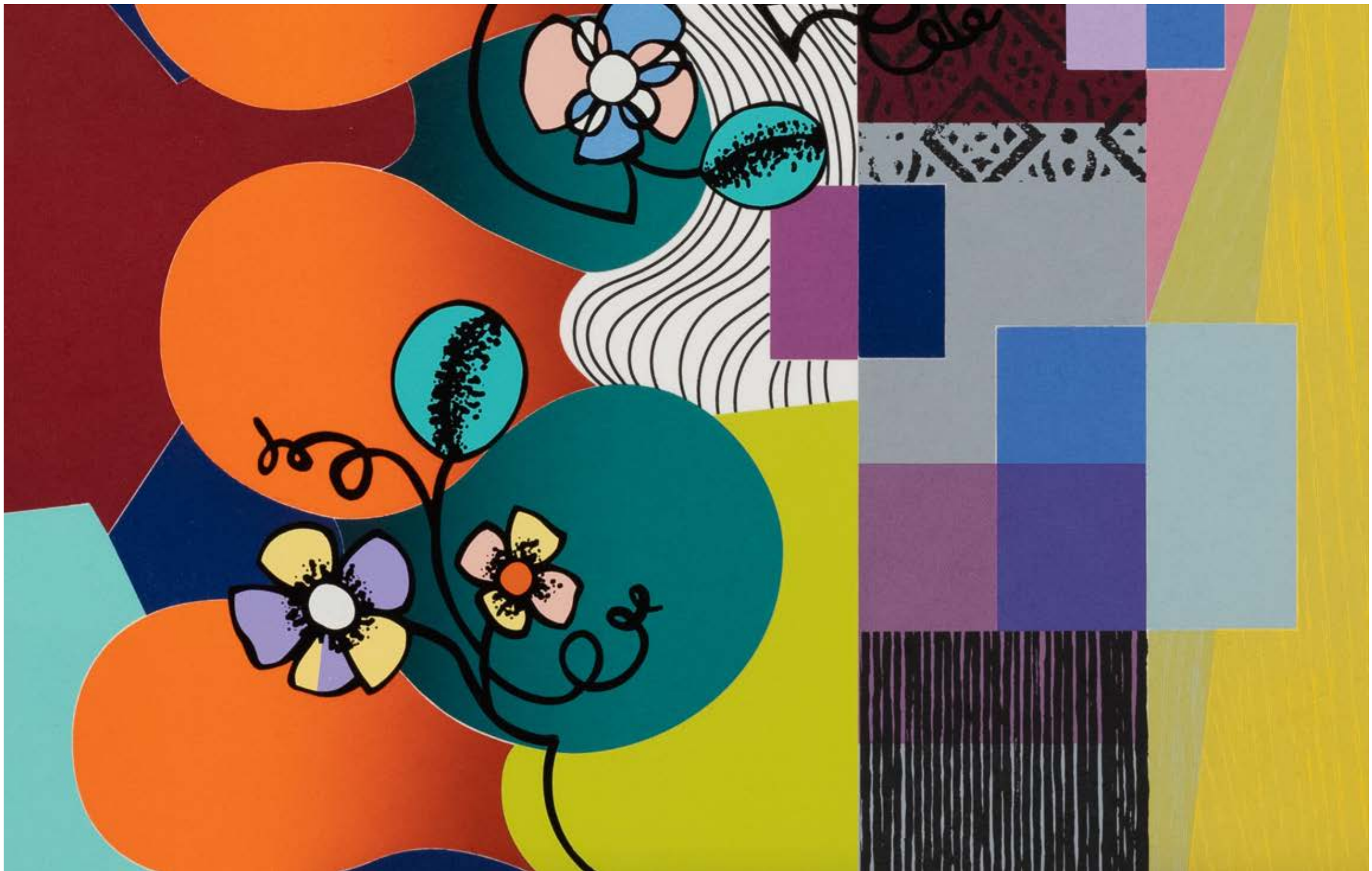
BEATRIZ MILHAZES Flower Swing, 2019 Detalhe [Detail]