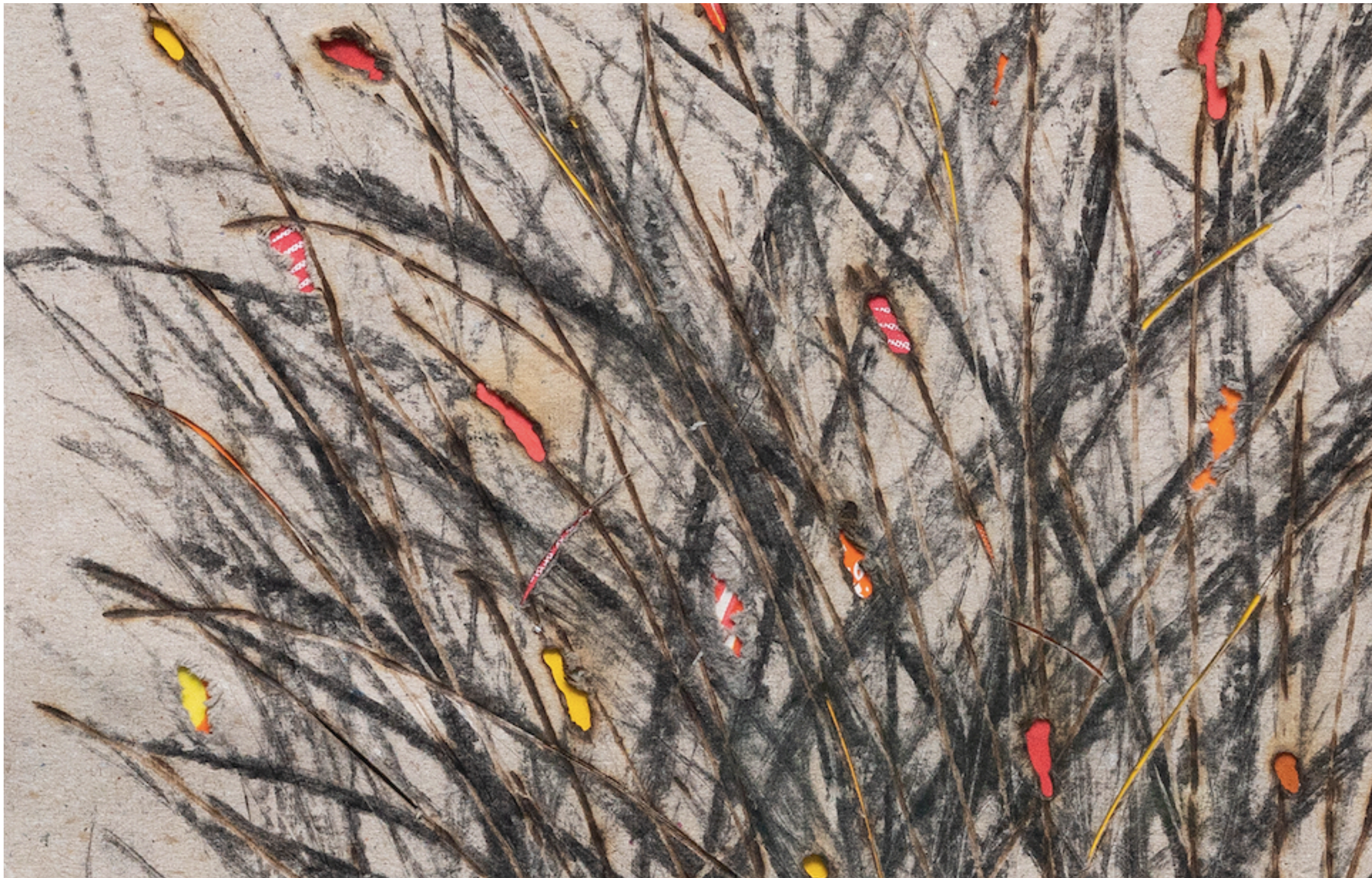
ANTONIO TARSIS Sem título [Untitled], 2023 Detalhe [Detail]