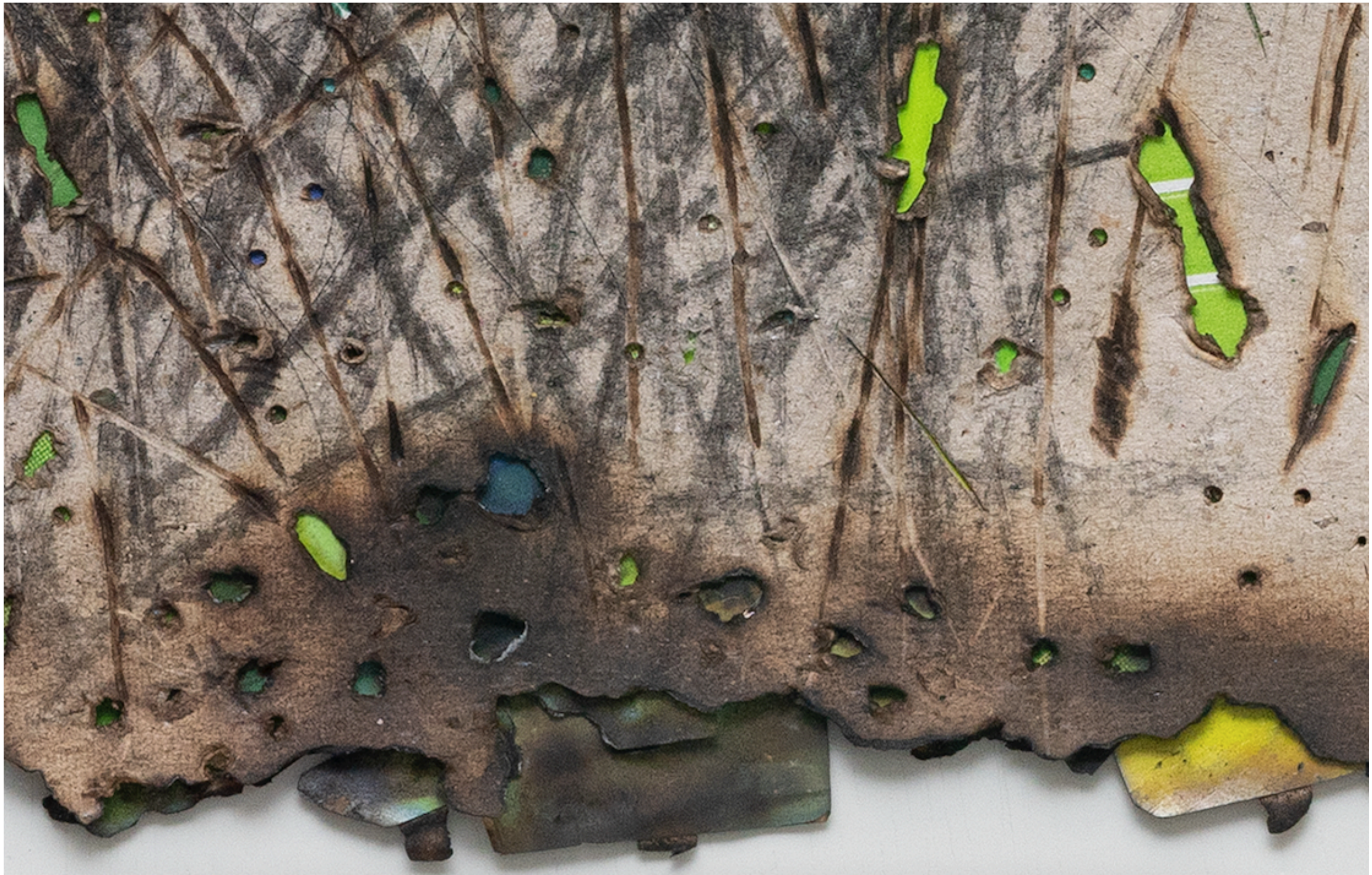
ANTONIO TARSIS Sem título [Untitled], 2023 Detalhe [Detail]