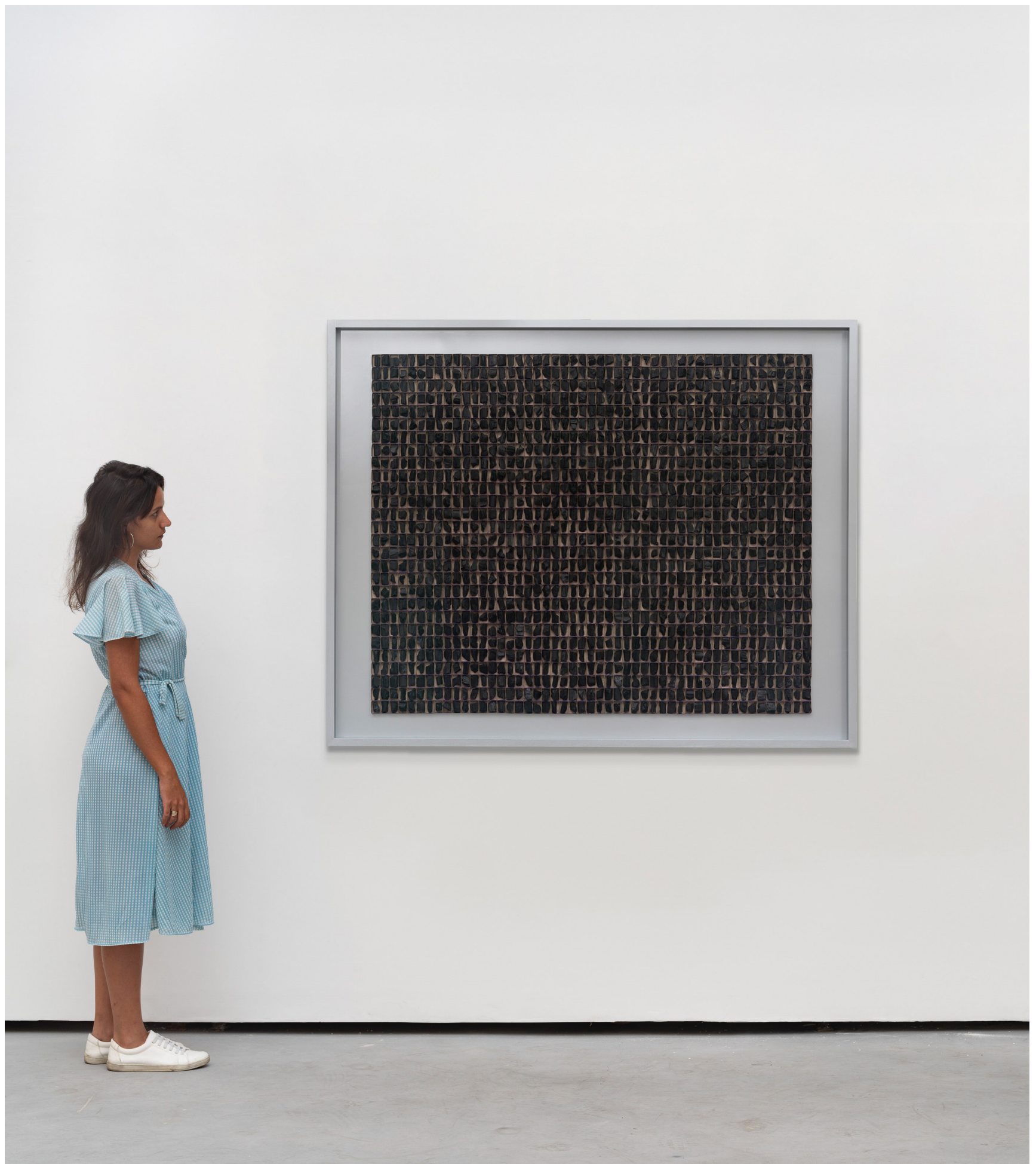
ANTONIO TARSIS Where the end begins II, 2023