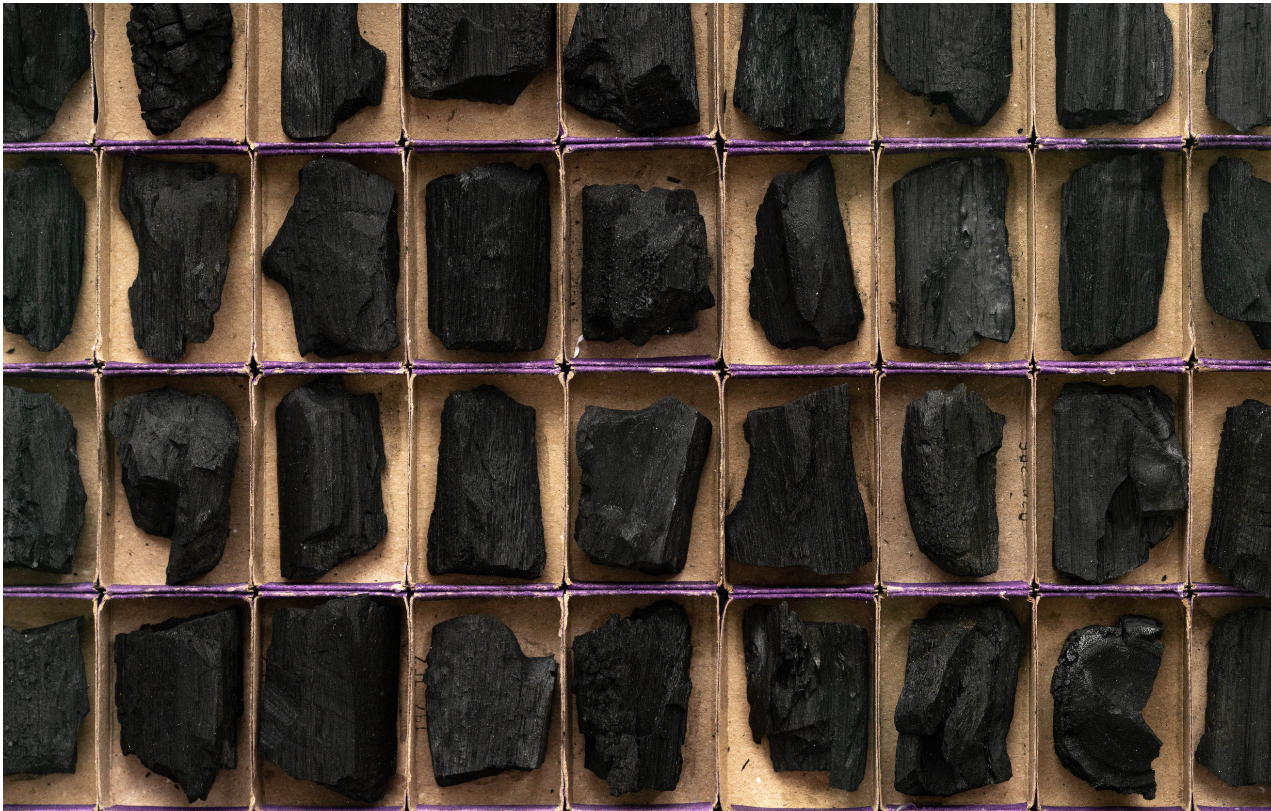
ANTONIO TARSIS Where the end begins II, 2023 Detalhe [Detail]