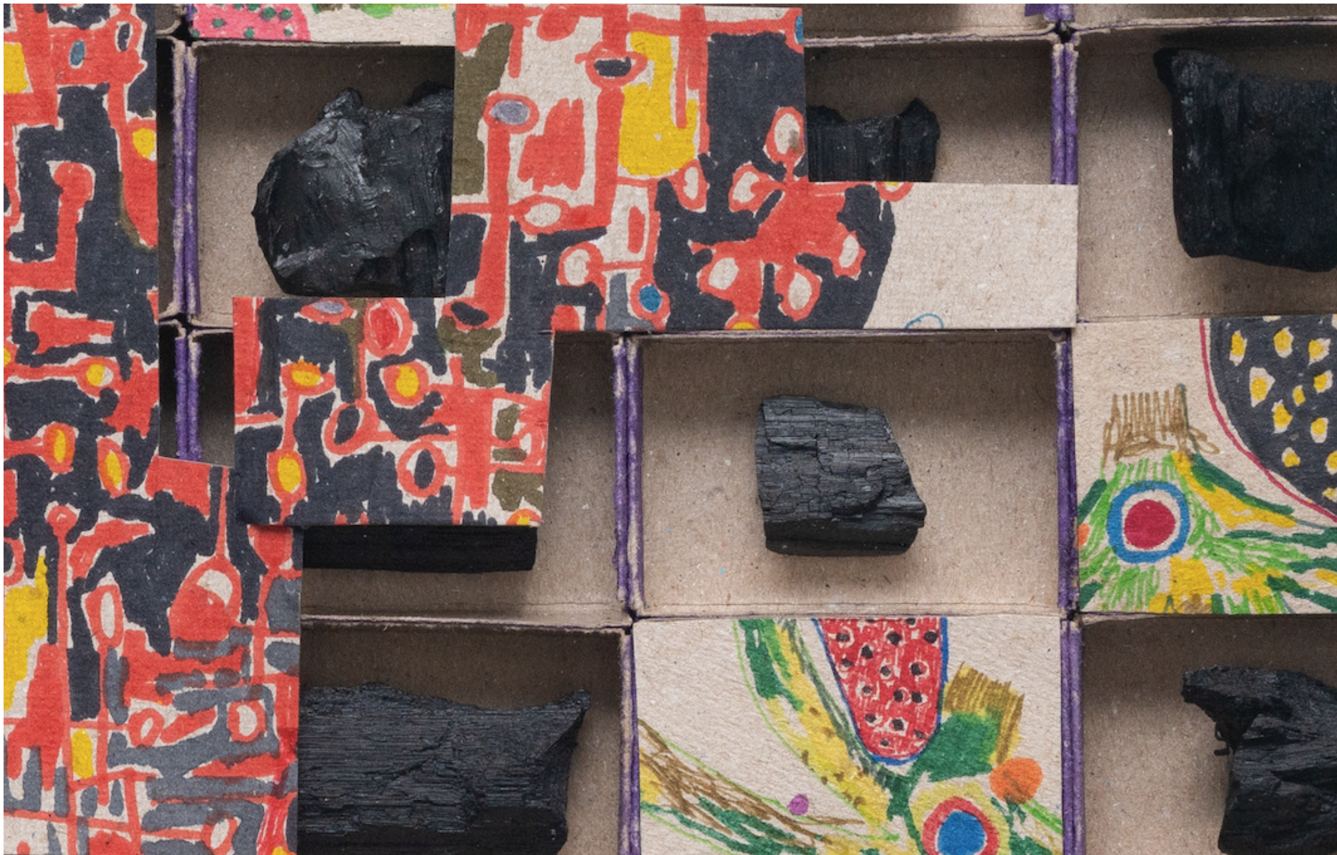
ANTONIO TARSIS Sem título [Untitled], 2023 Detalhe [Detail]