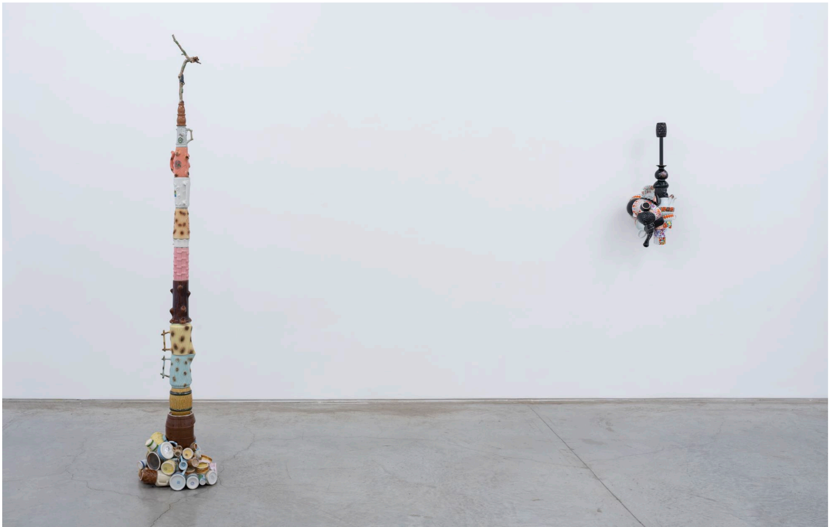
Fala Coisa Carpintaria | Rio de Janeiro, Brasil, 2022