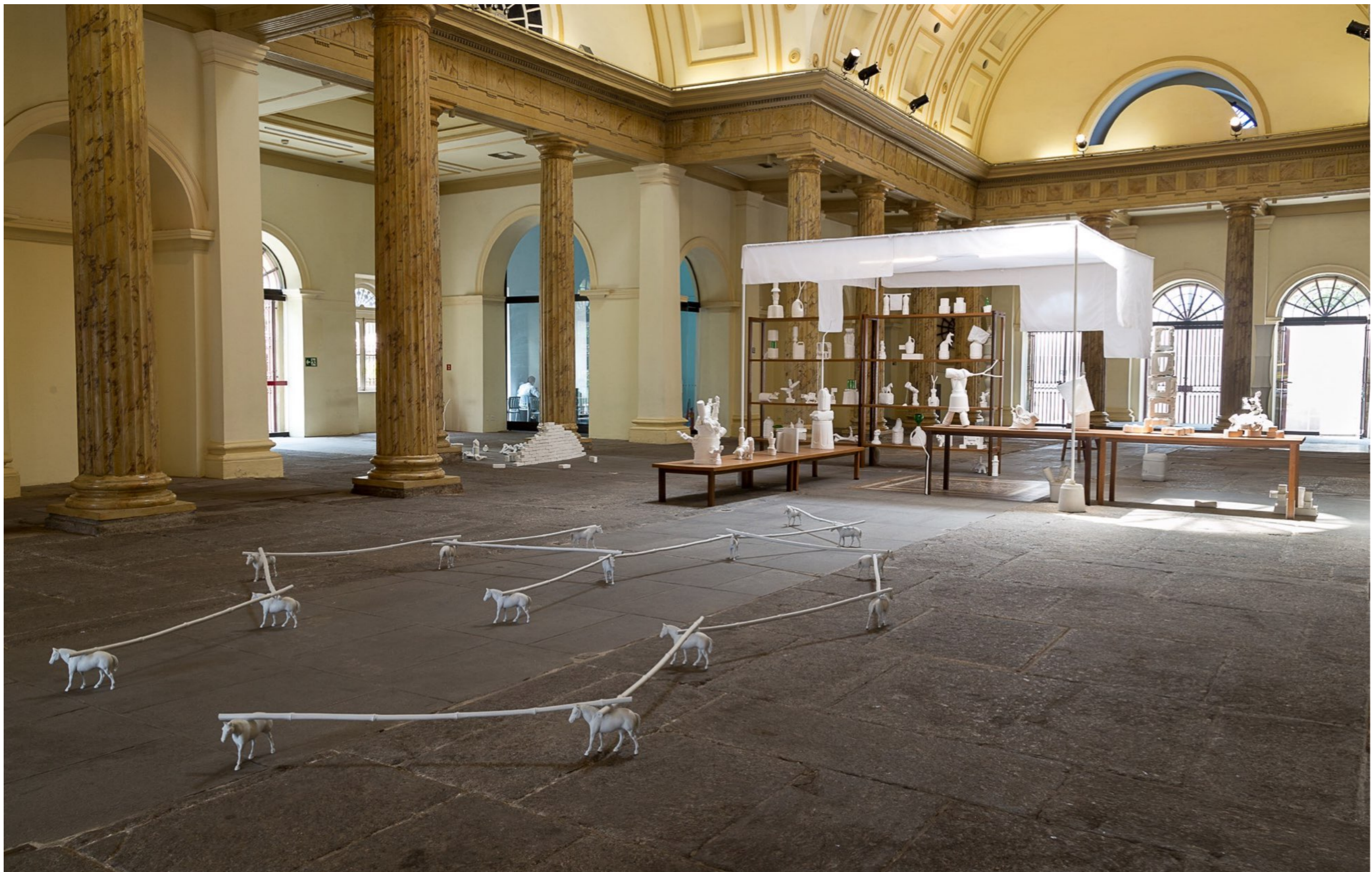
Fora Daqui Casa França-Brasil | Rio de Janeiro, Brasil, 2015