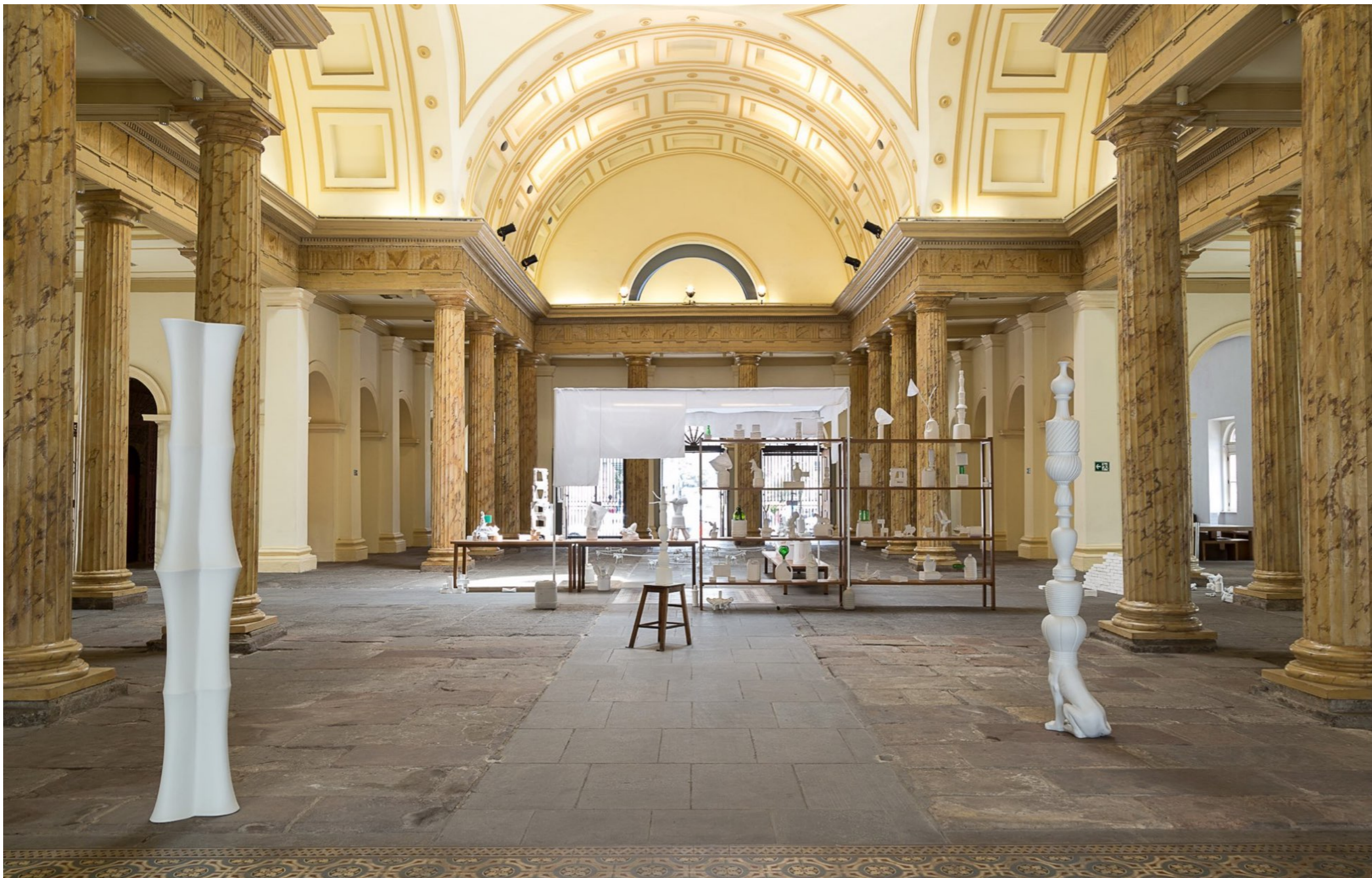
Fora Daqui Casa França-Brasil | Rio de Janeiro, Brasil, 2015