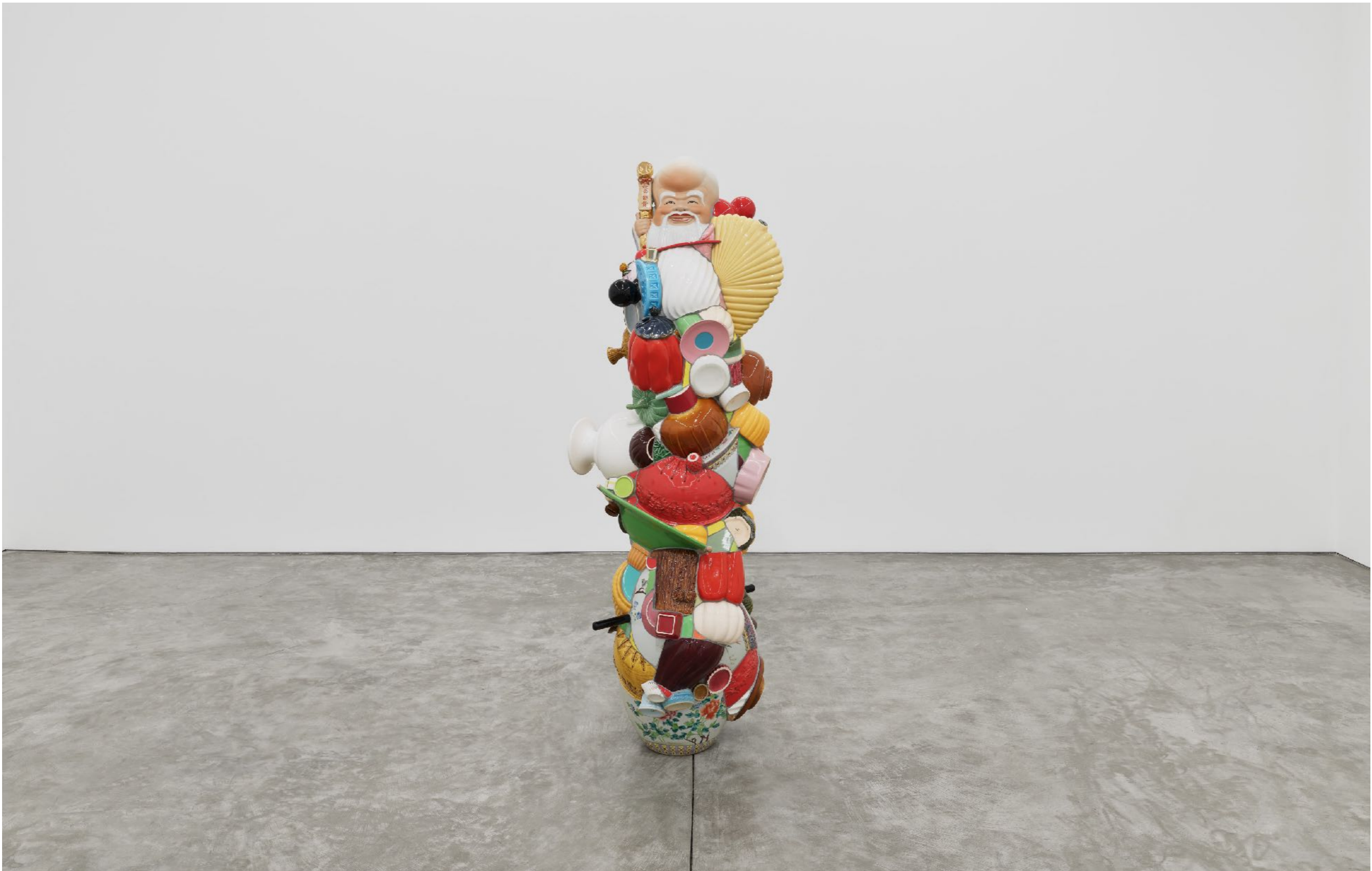
Barrão: Stuck Rhyme Night Gallery | Los Angeles, USA, 2024