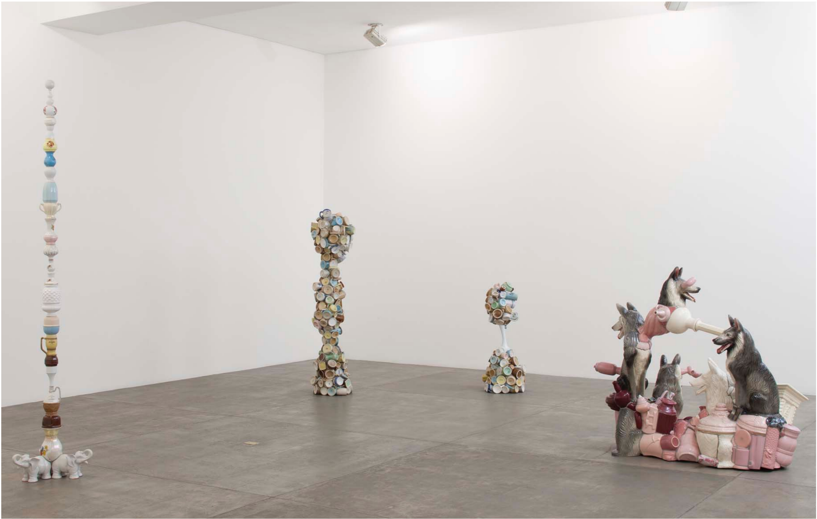
Barrão Galeria Fortes Vilaça | São Paulo, Brasil, 2012