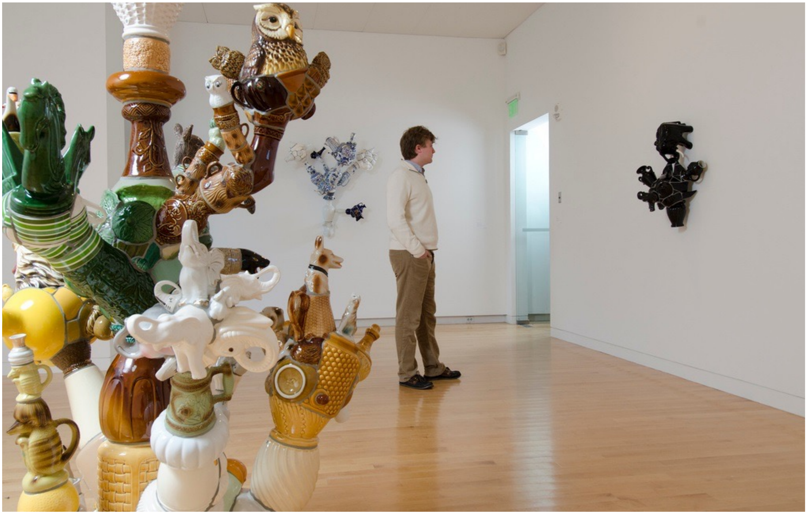
Mashups The Aldrich Contemporary Art Museum | Ridgefield, USA, 2012