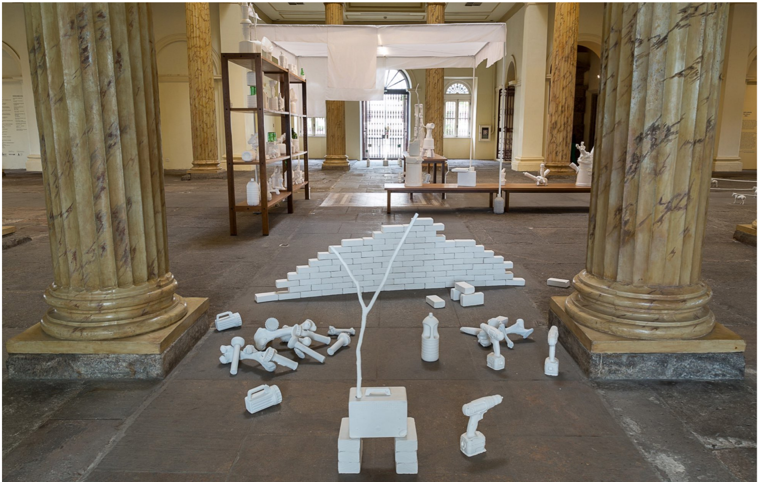
Fora Daqui Casa França-Brasil | Rio de Janeiro, Brasil, 2015