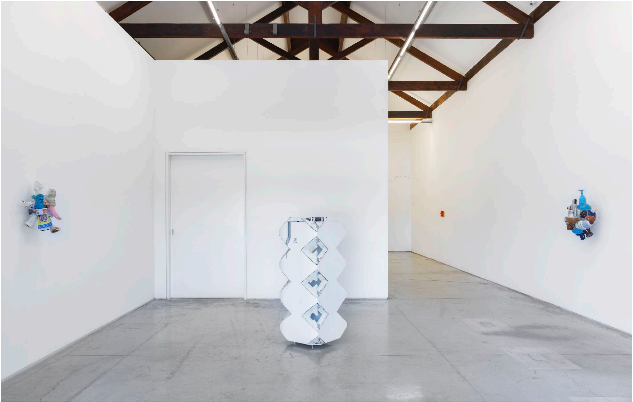
Fala Coisa Carpintaria | Rio de Janeiro, Brasil, 2022