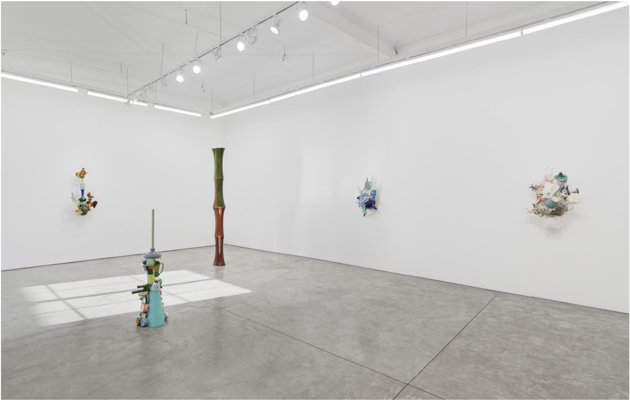
Barrão: Stuck Rhyme Night Gallery | Los Angeles, USA, 2024