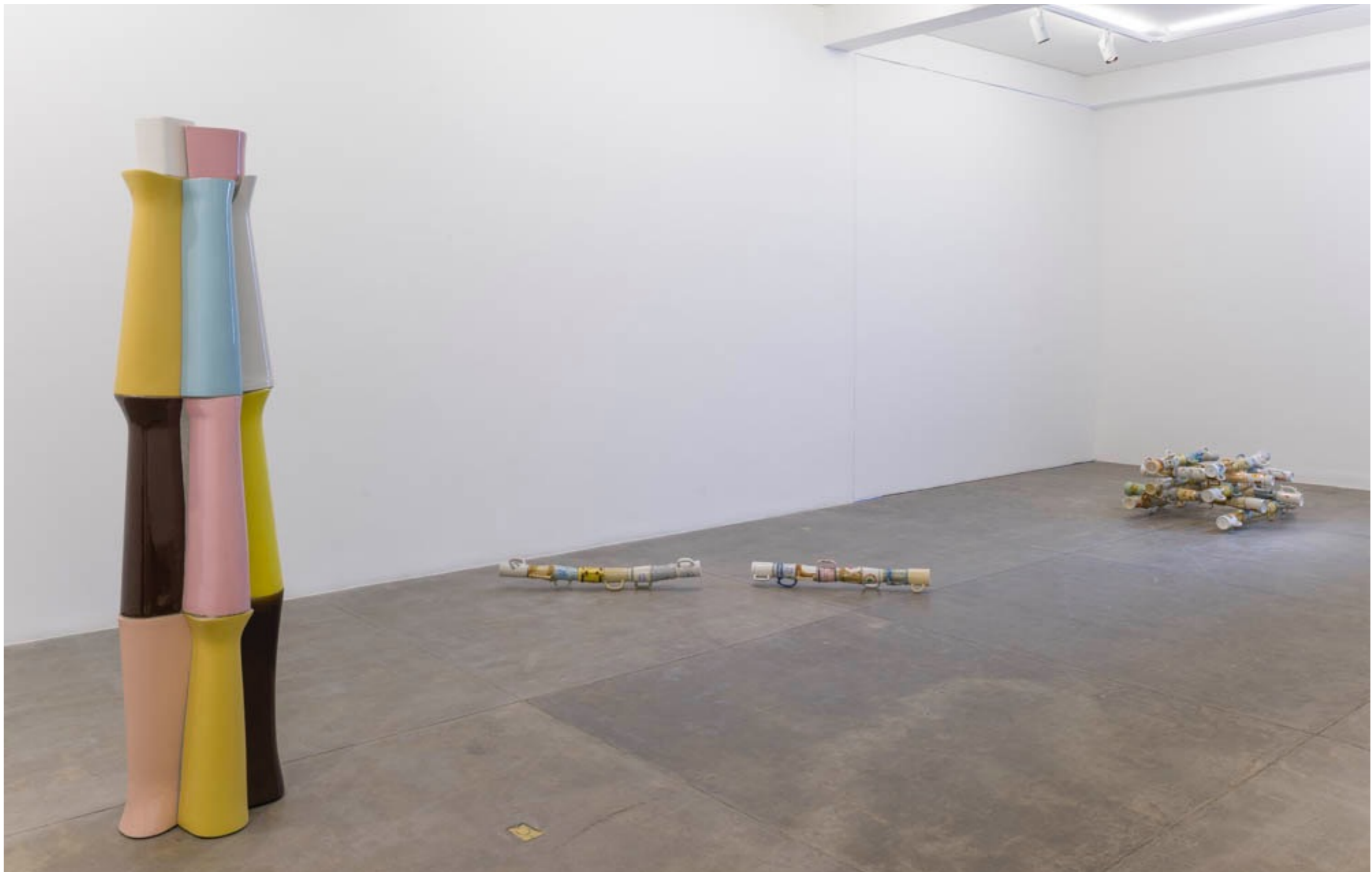
Lugar nenhum Galeria Fortes Vilaça | São Paulo, Brasil, 2014