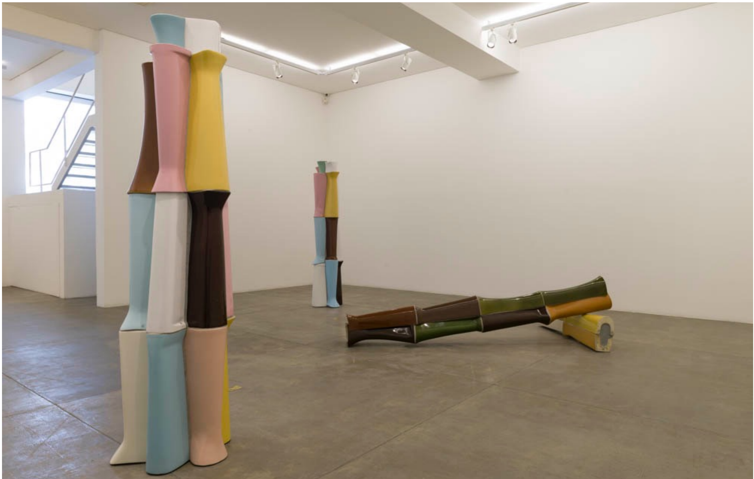
Lugar nenhum Galeria Fortes Vilaça | São Paulo, Brasil, 2014