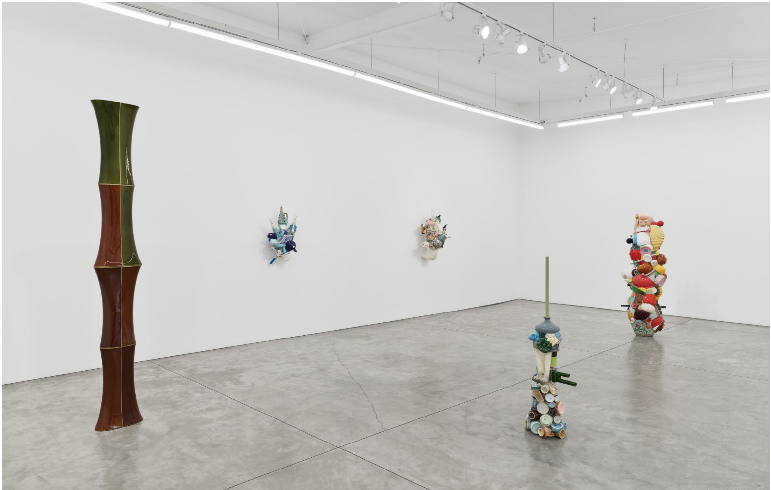
Barrão: Stuck Rhyme Night Gallery | Los Angeles, USA, 2024