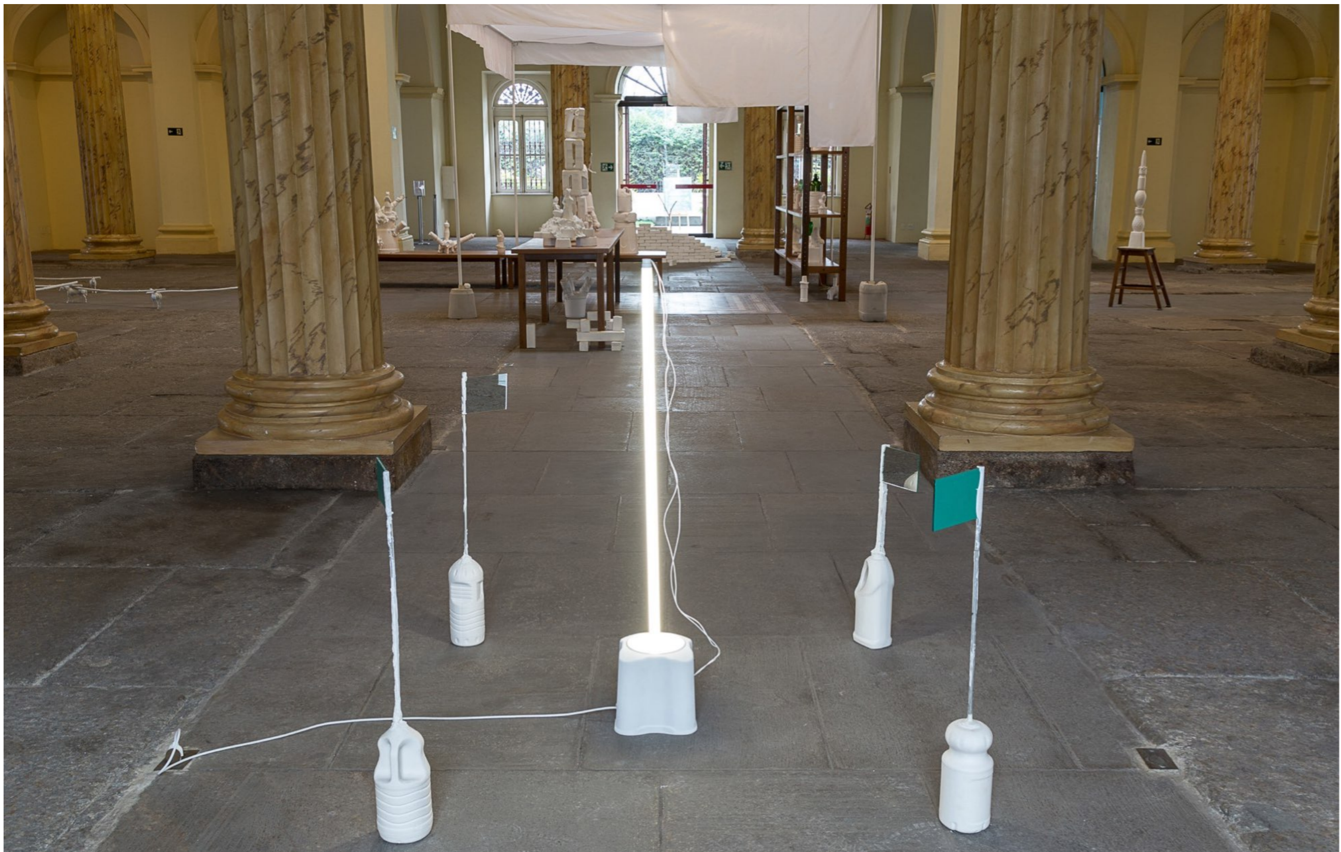
Fora Daqui Casa França-Brasil | Rio de Janeiro, Brasil, 2015