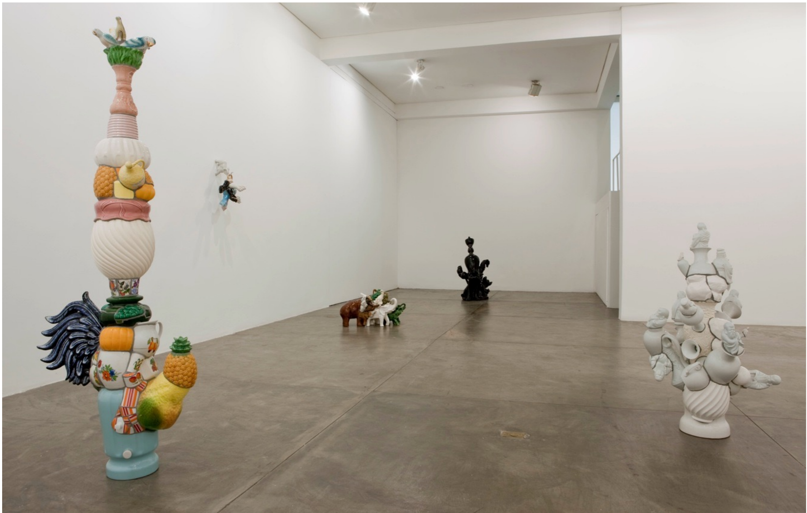
Barrão Galeria Fortes Vilaça | São Paulo, Brasil, 2009