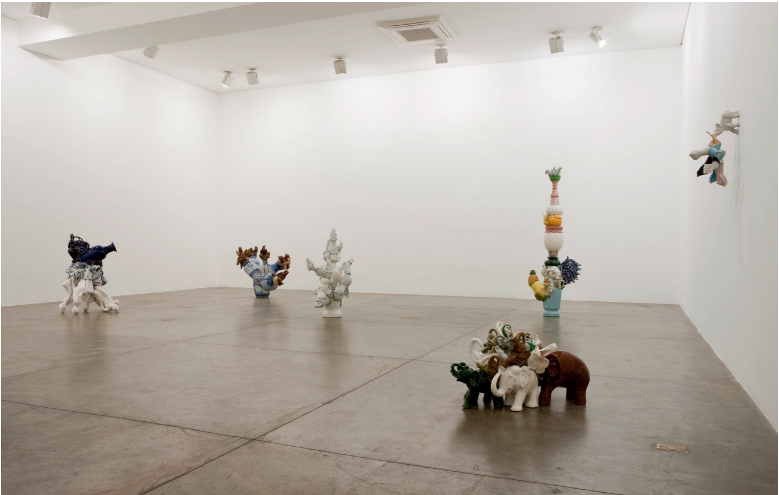
Barrão Galeria Fortes Vilaça | São Paulo, Brasil, 2009