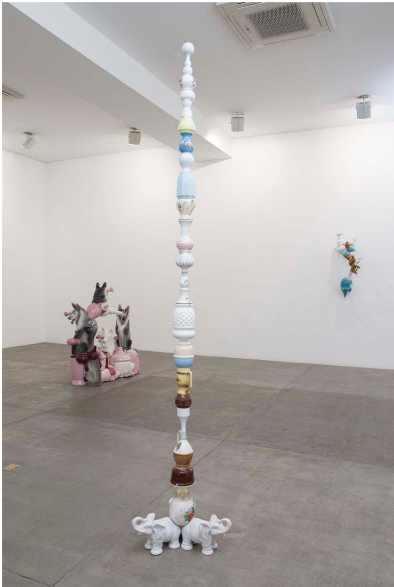
Barrão Galeria Fortes Vilaça | São Paulo, Brasil, 2012