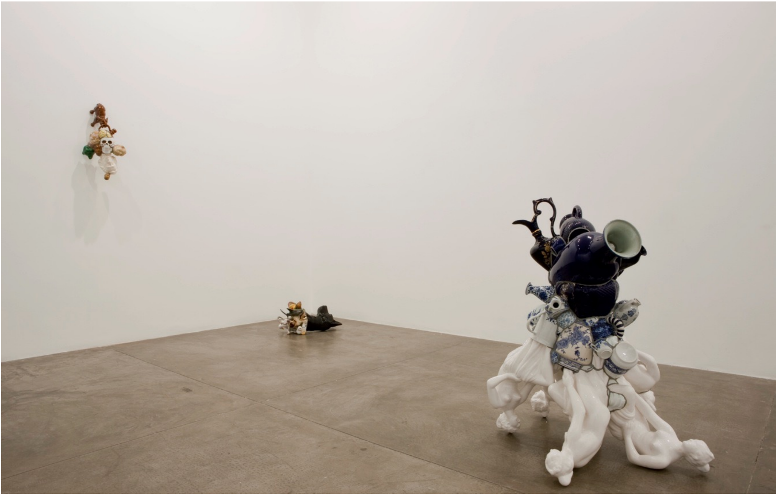
Barrão Galeria Fortes Vilaça | São Paulo, Brasil, 2009