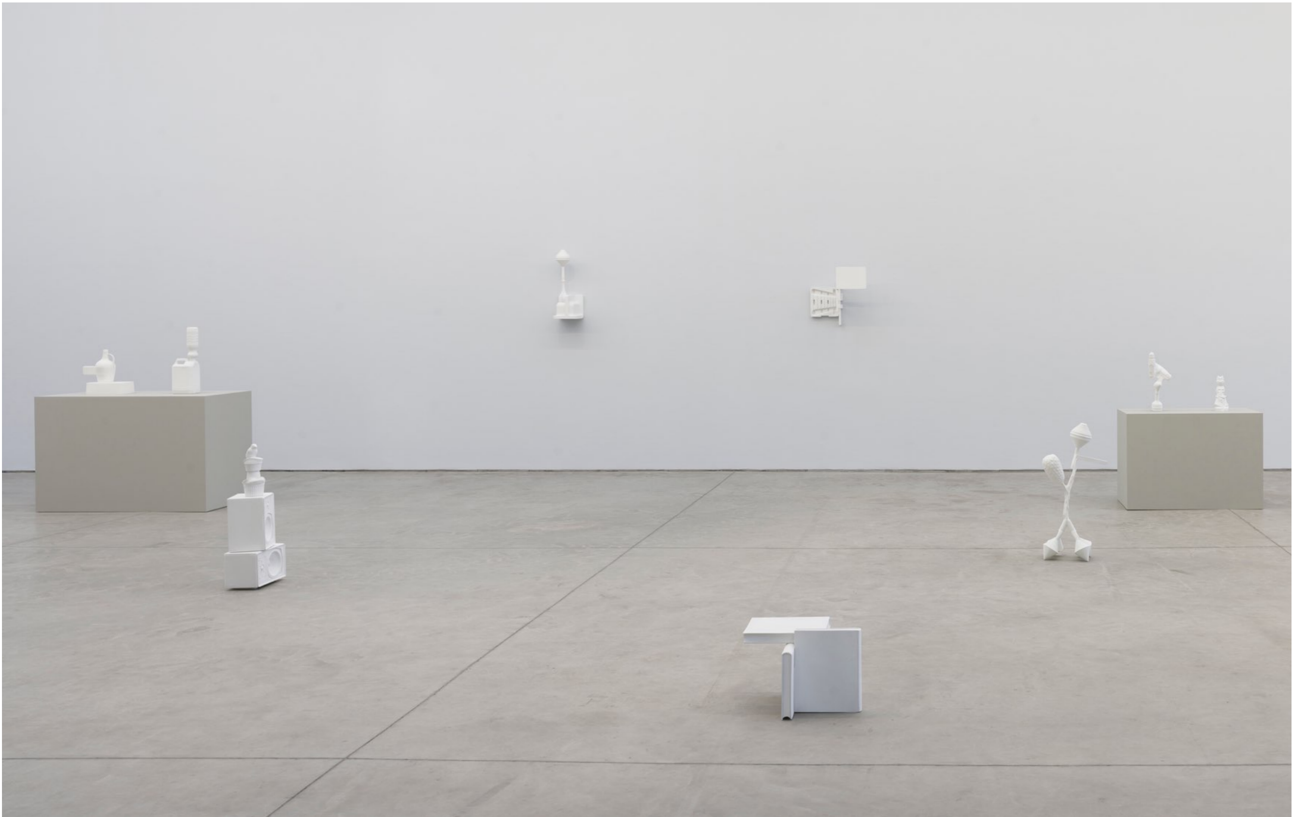
Paleotoca Galpão Fortes Vilaça | São Paulo, Brasil, 2016