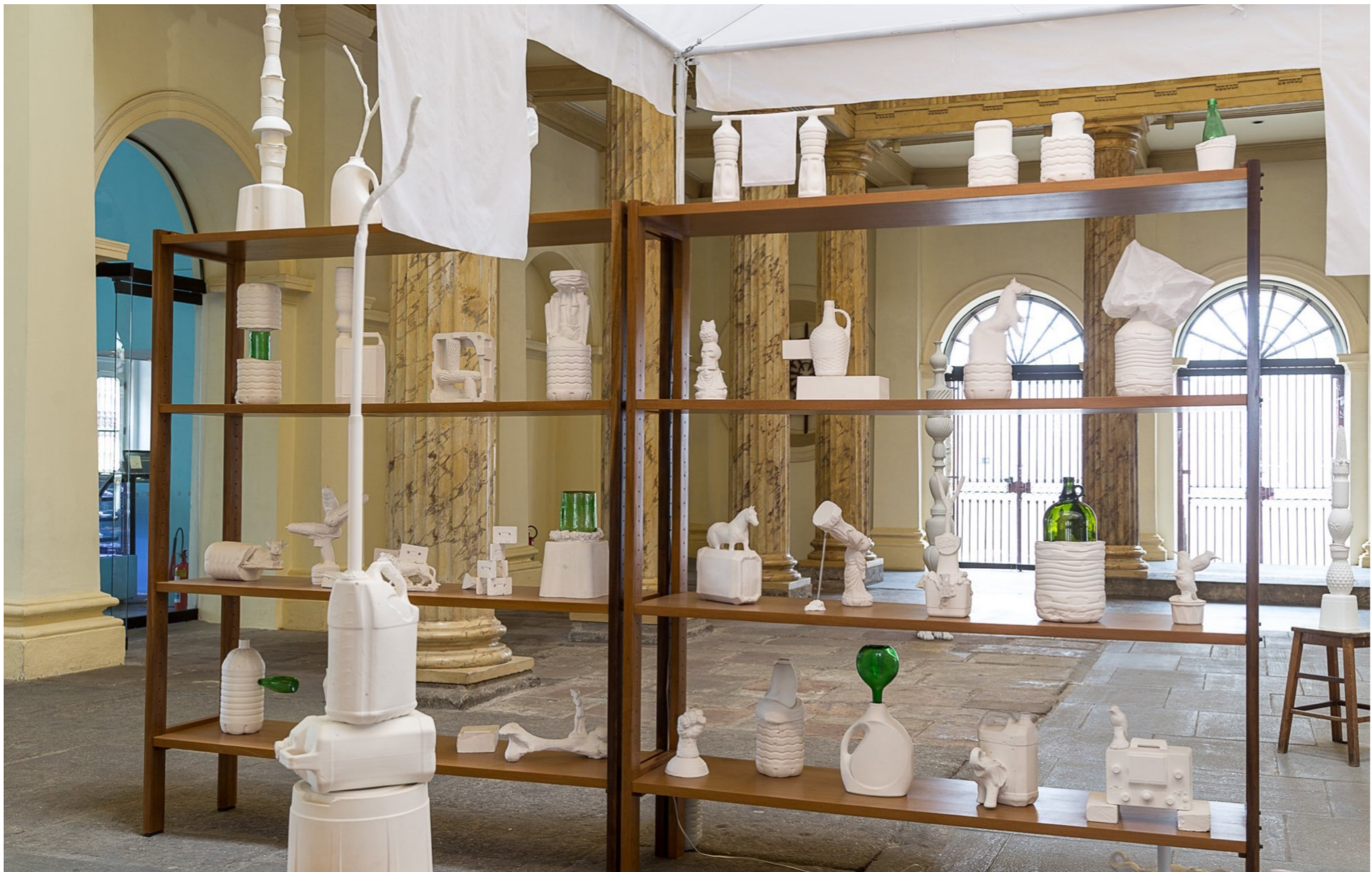
Fora Daqui Casa França-Brasil | Rio de Janeiro, Brasil, 2015