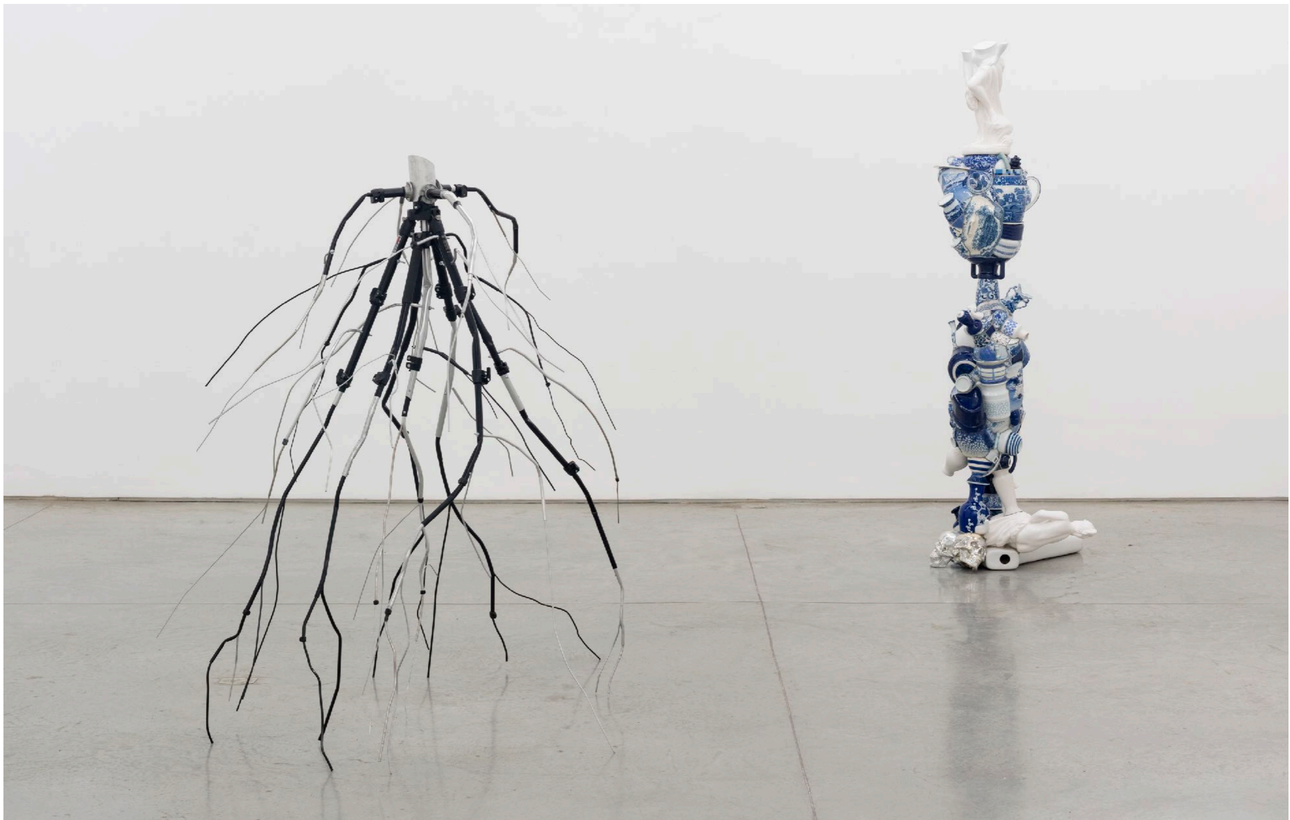
Fala Coisa Carpintaria | Rio de Janeiro, Brasil, 2022