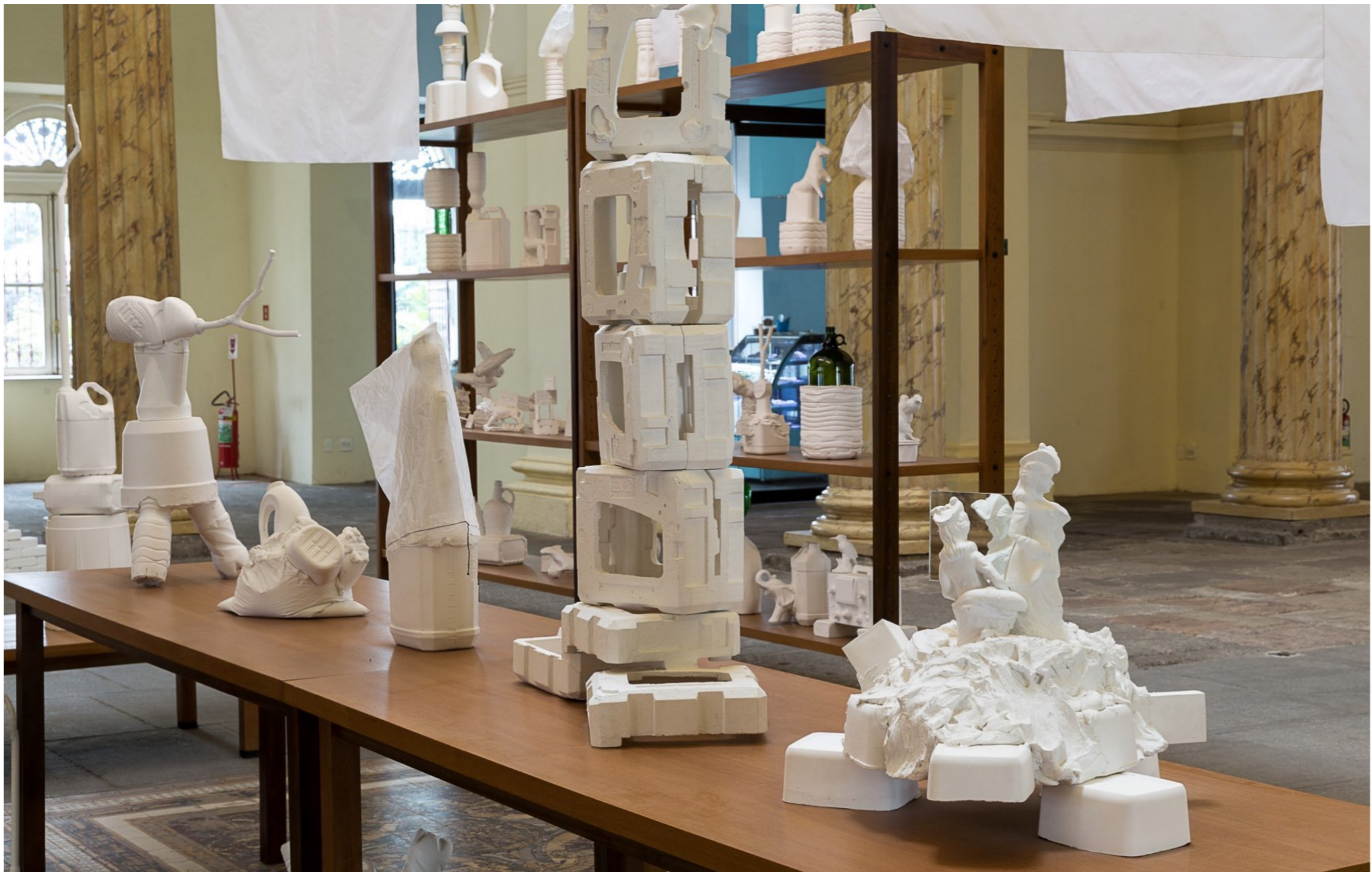
Fora Daqui Casa França-Brasil | Rio de Janeiro, Brasil, 2015