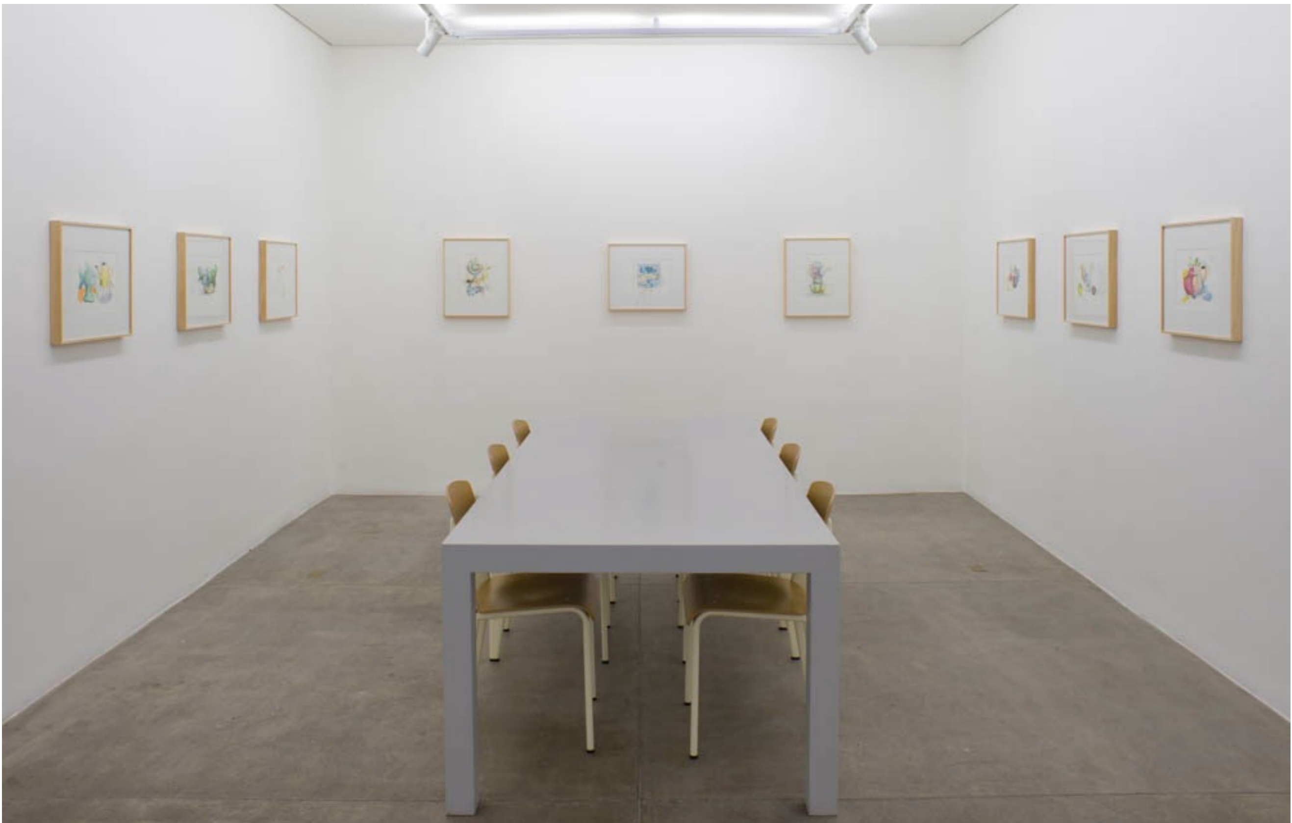
Lugar nenhum Galeria Fortes Vilaça | São Paulo, Brasil, 2014