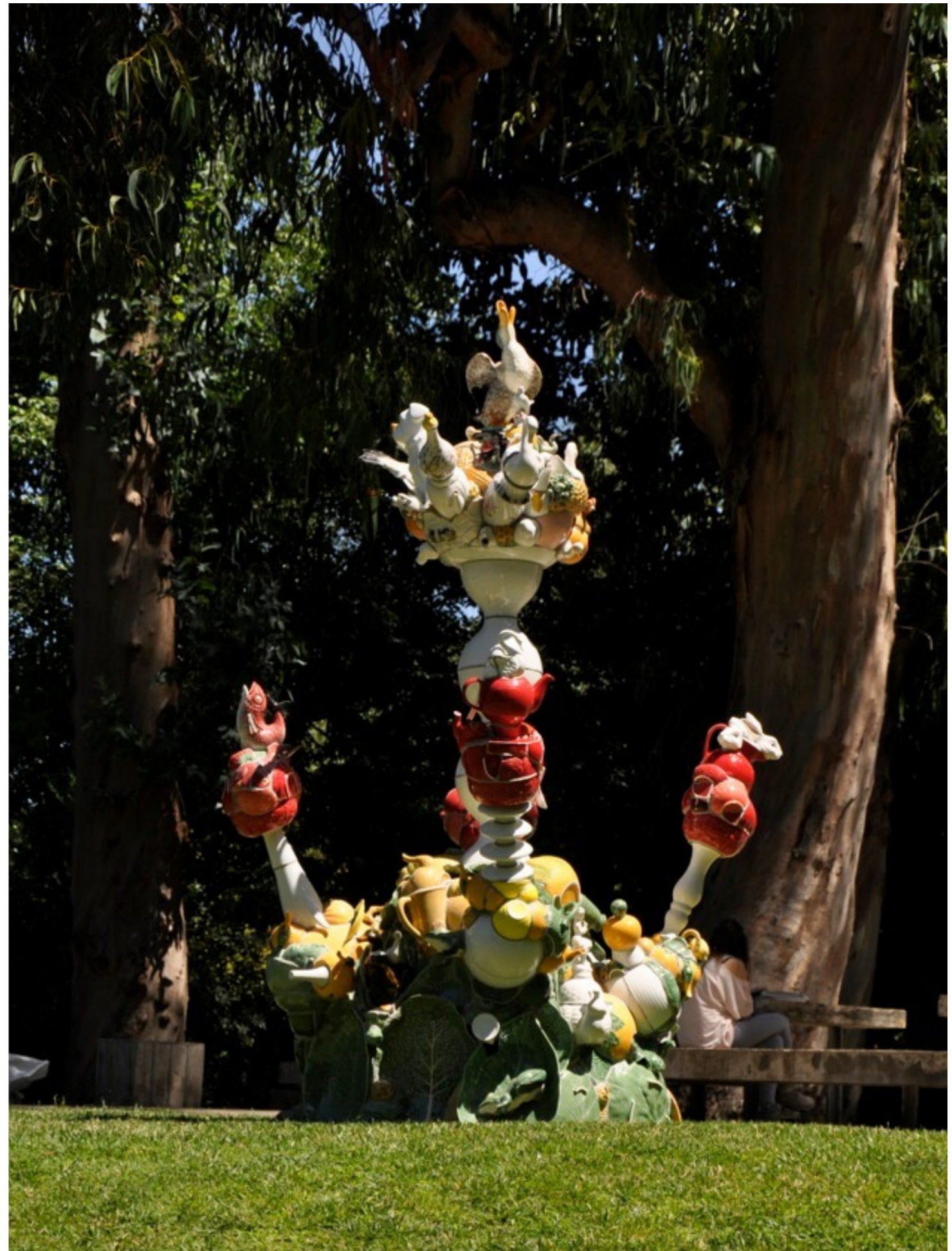
Natureza Morta Fundação Calouste Gulbenkian | Lisboa, Portugal, 2010