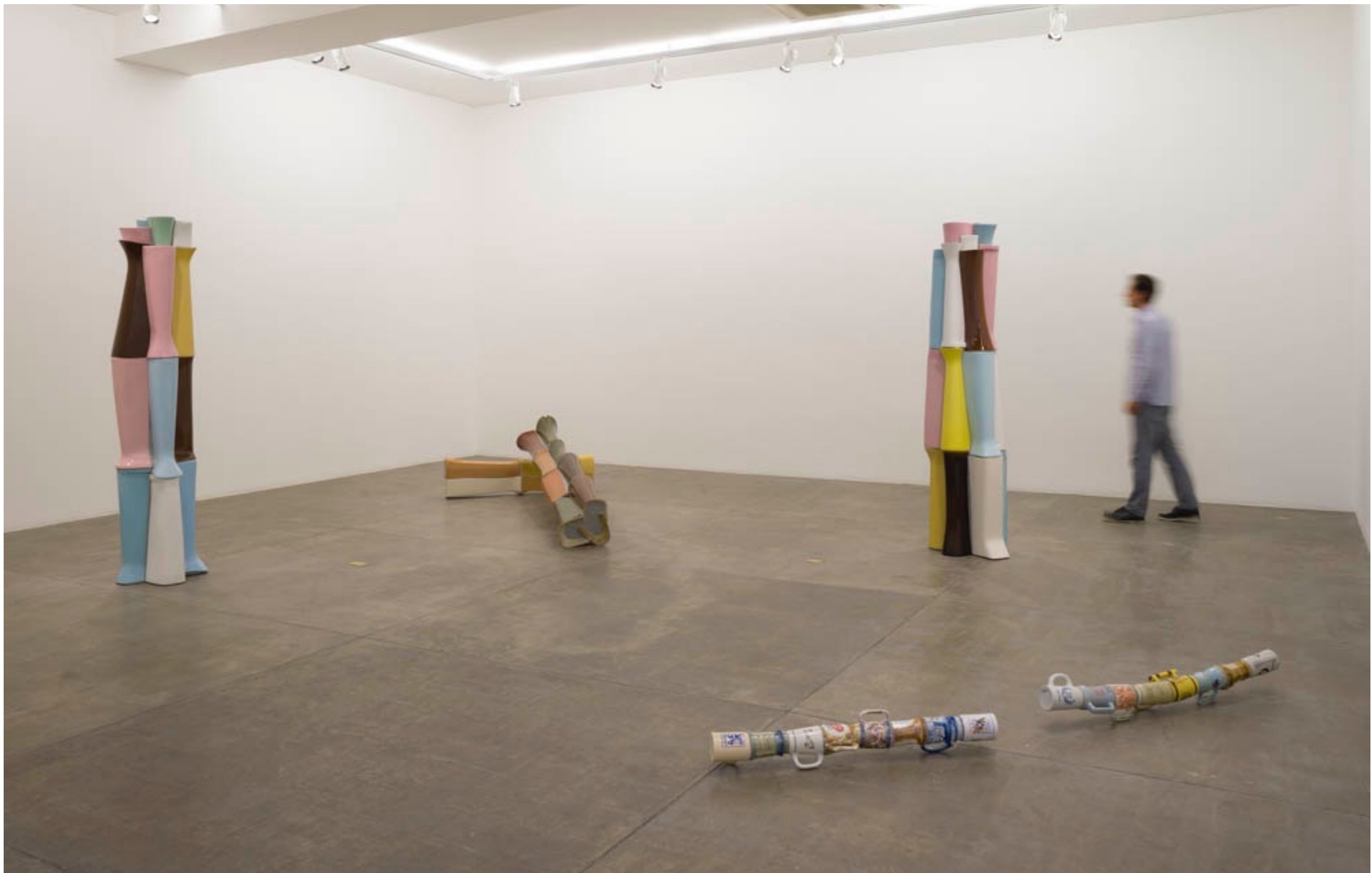
Lugar nenhum Galeria Fortes Vilaça | São Paulo, Brasil, 2014