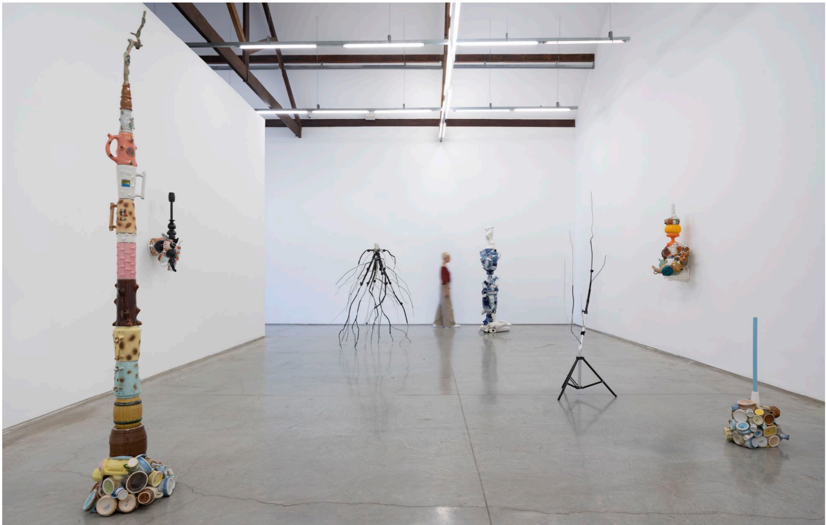
Fala Coisa Carpintaria | Rio de Janeiro, Brasil, 2022