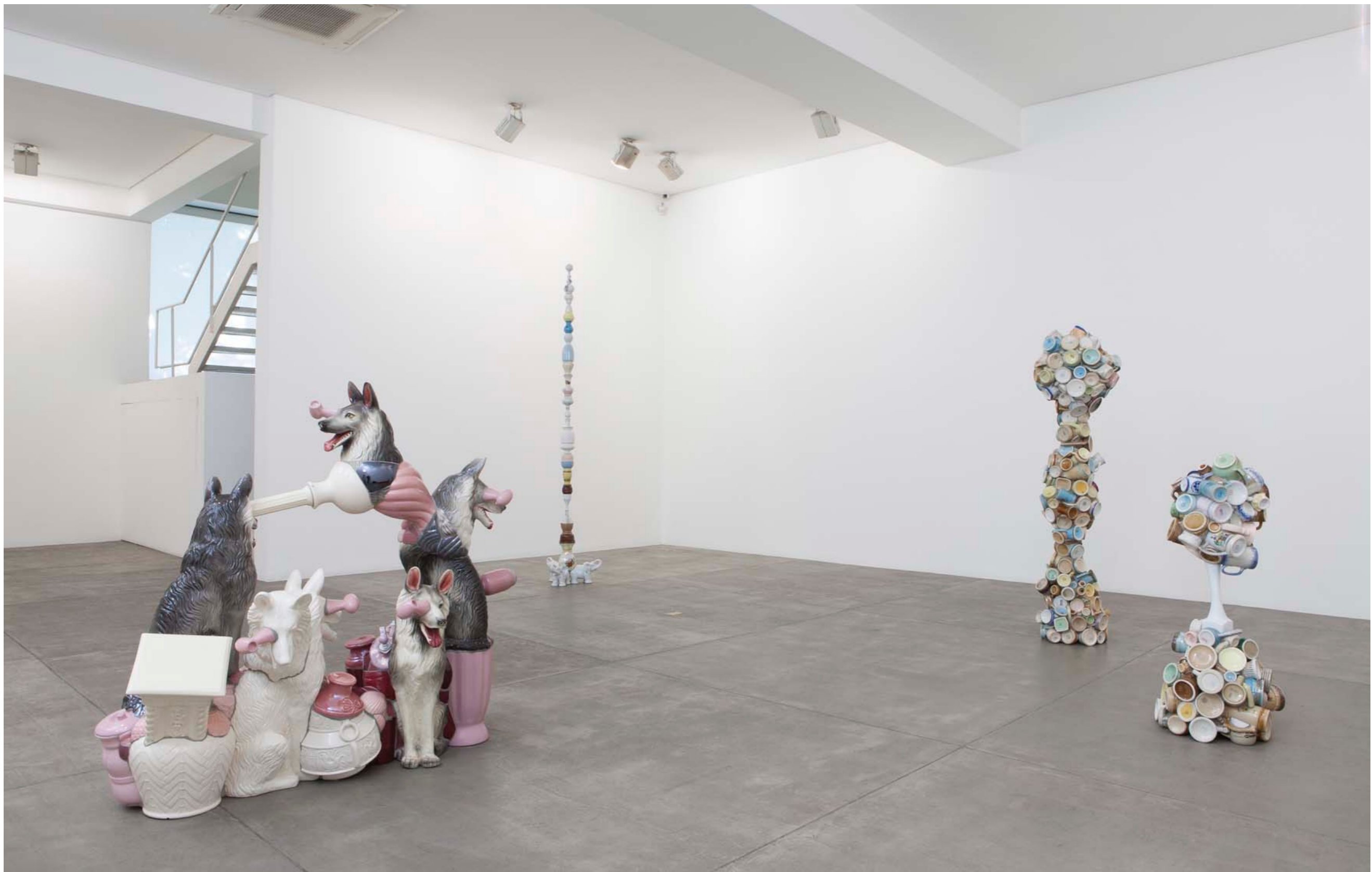
Barrão Galeria Fortes Vilaça | São Paulo, Brasil, 2012