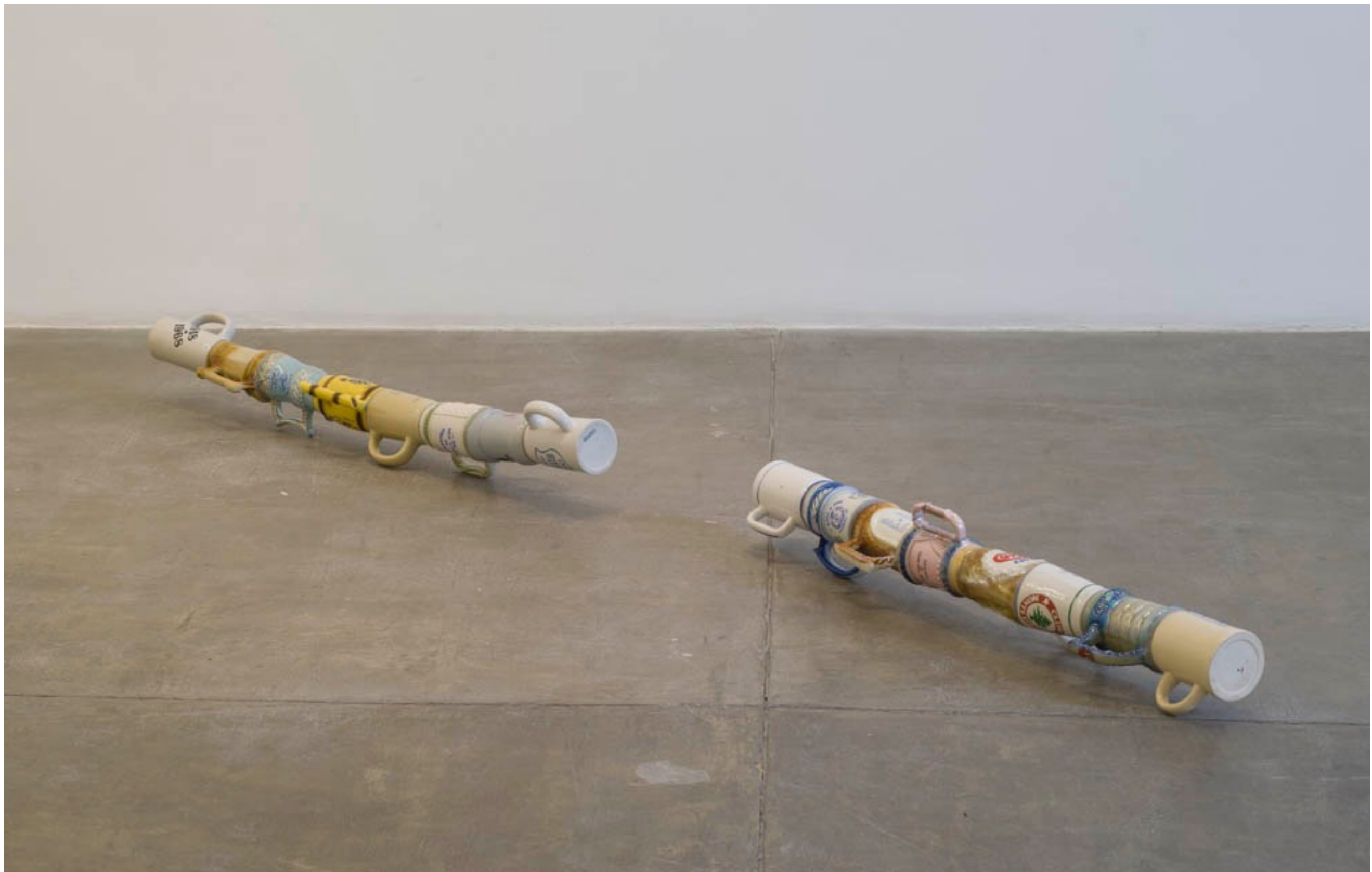
Lugar nenhum Galeria Fortes Vilaça | São Paulo, Brasil, 2014