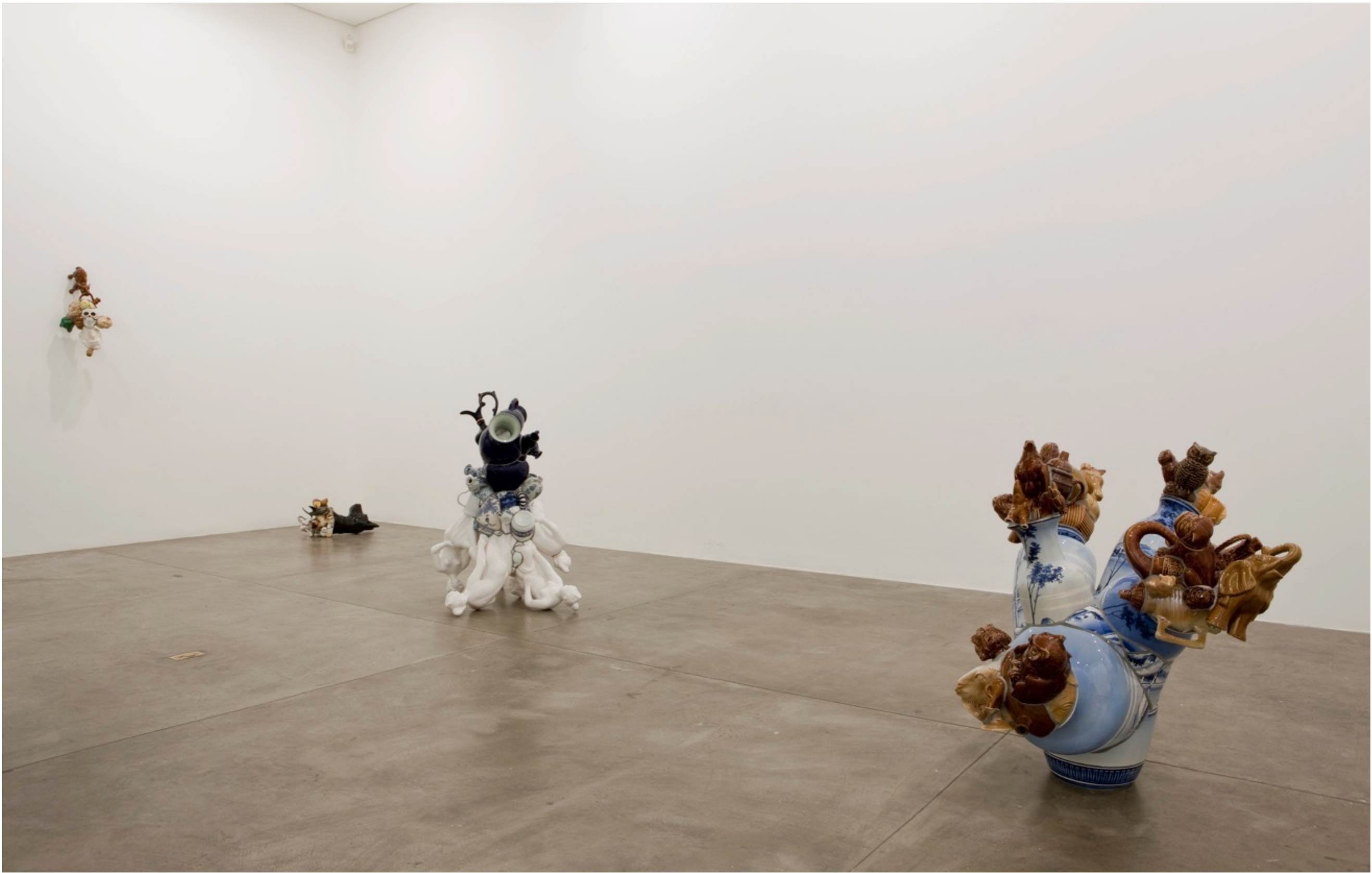
Barrão Galeria Fortes Vilaça | São Paulo, Brasil, 2009