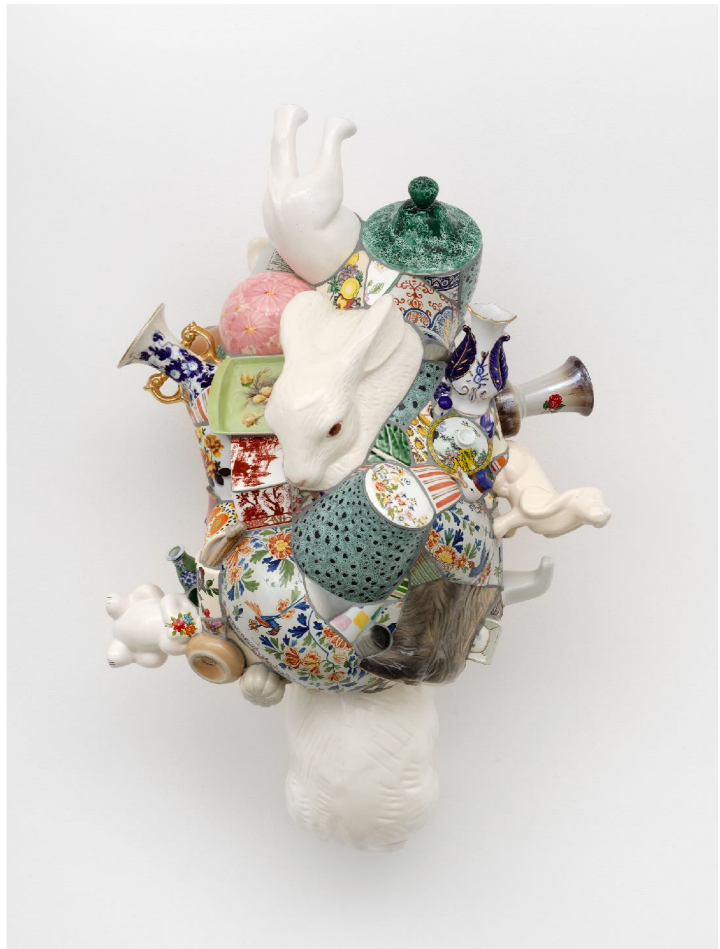
BARRÃO Cabeça Noise, 2023 Porcelana e resina epóxi [Porcelain and epoxy resin] 98 x 61.5 x 47 cm [38.583 x 24.213 x 18.504 in]