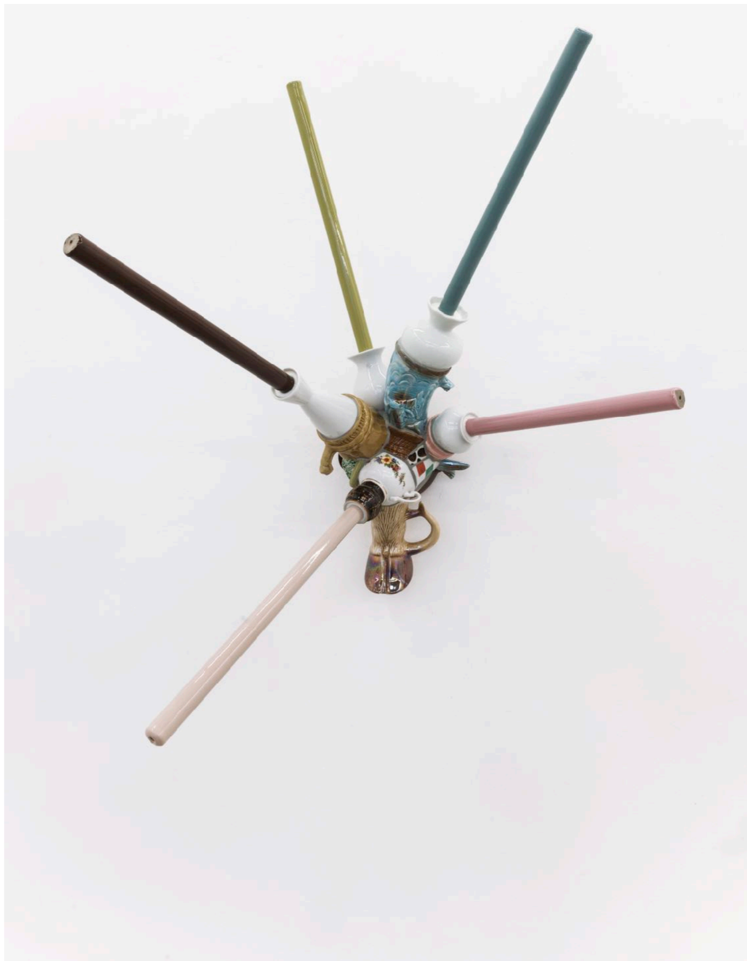
BARRÃO Rojão, 2018 Louça e resina epoxi [Porcelain and epoxy resin] 85 x 62 x 64 cm [33 x 24 x 25 in]