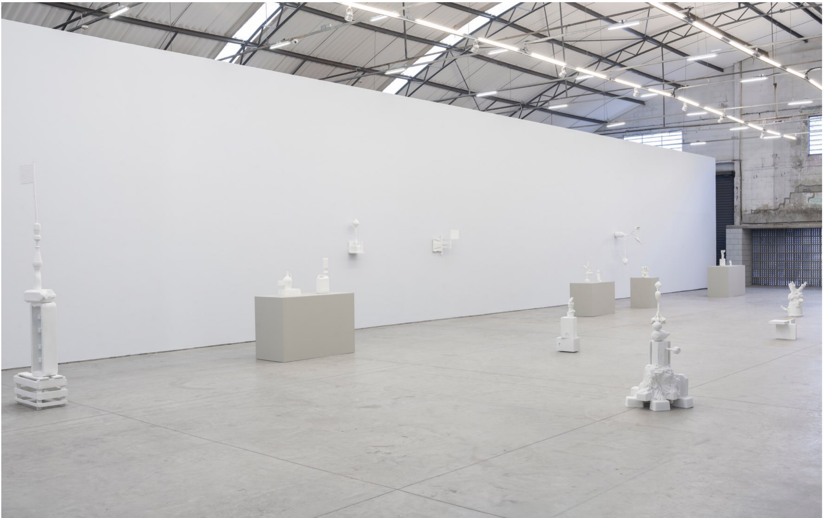
Paleotoca Galpão Fortes Vilaça | São Paulo, Brasil, 2016