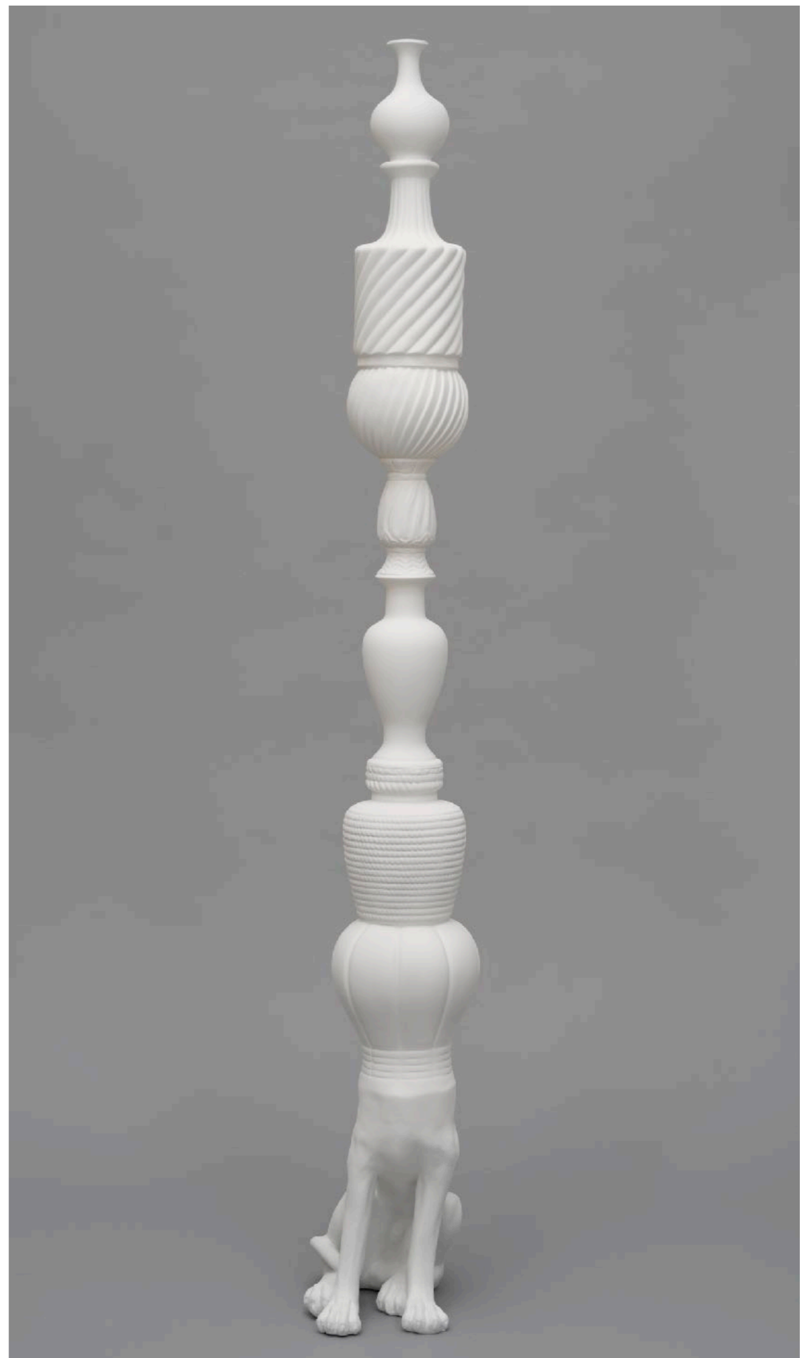
BARRÃO Ja Fui Jarro, 2015 Resina e tinta enamel [Epoxy resin and synthetic enamel] 252 x 32 x 46 cm [99 x 12 x 18 in]