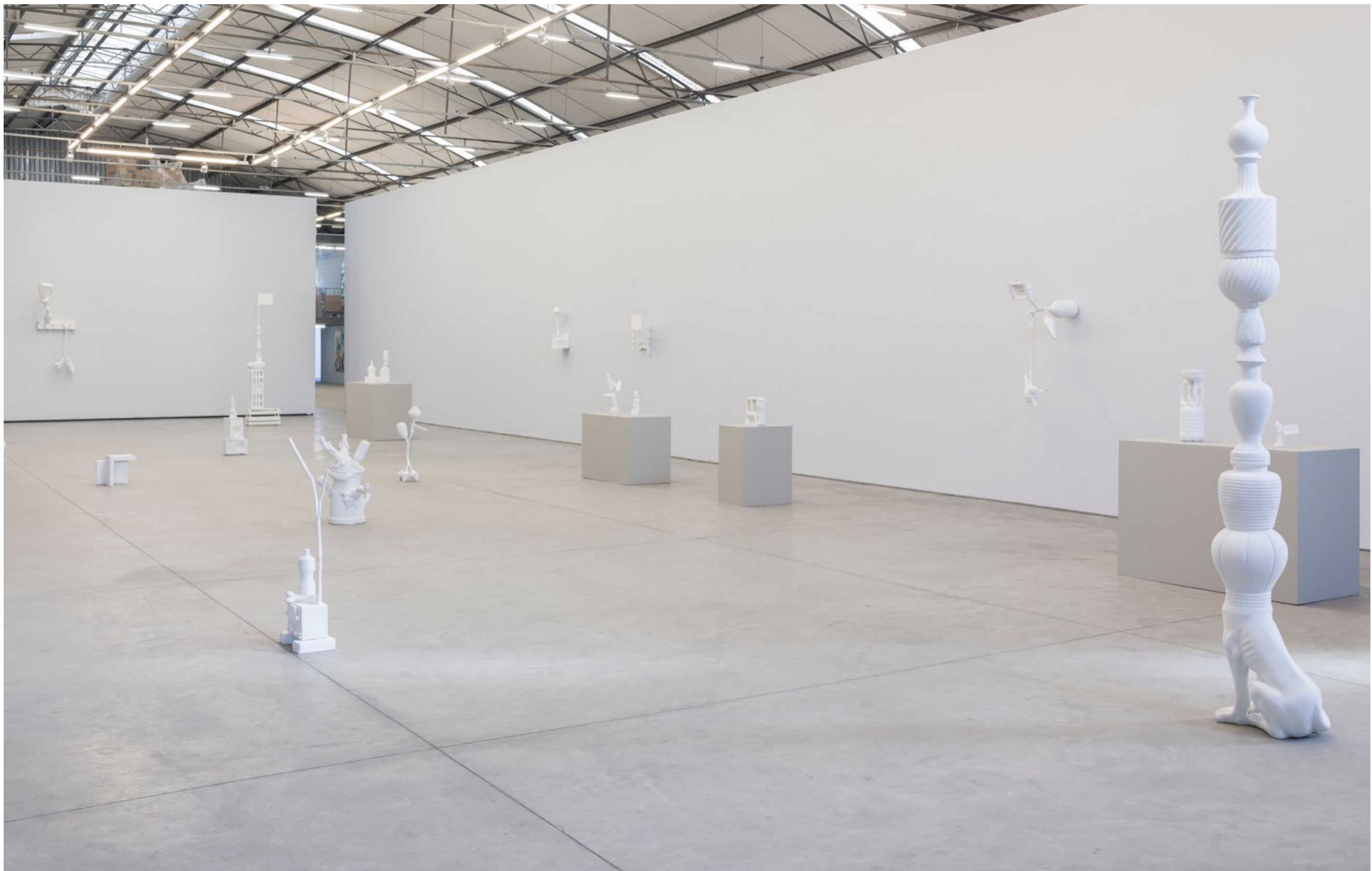
Paleotoca Galpão Fortes Vilaça | São Paulo, Brasil, 2016